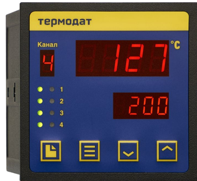
Термодат-11 М6 Количество каналов: 2,3,4

Добавлено ПИД- регулирование RS-485 (опция)