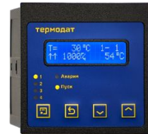
Алфавитно-цифровой двухстрочный индикатор