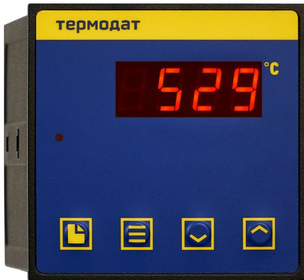
Термодат-10 М6 10М6/1УВ/1Р/1Т