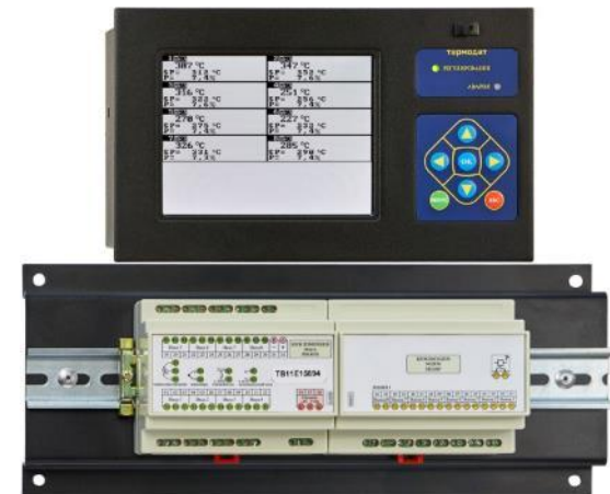
Многоканальные приборы (8, 12, 24 канала)