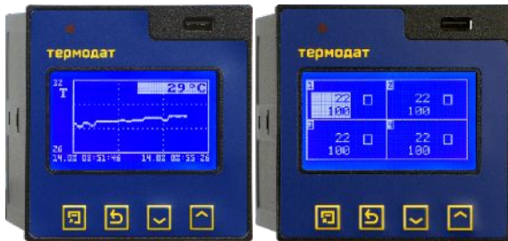
Графический дисплей 3,5"