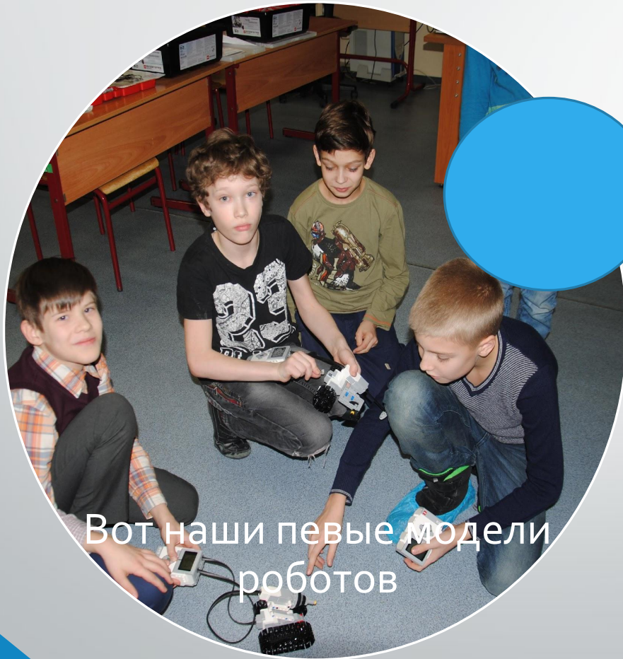
Вот наши первые модели роботов

В нашем лицее 1501 начал свою работу кружок: «Робототехника». Ждем всех желающих.