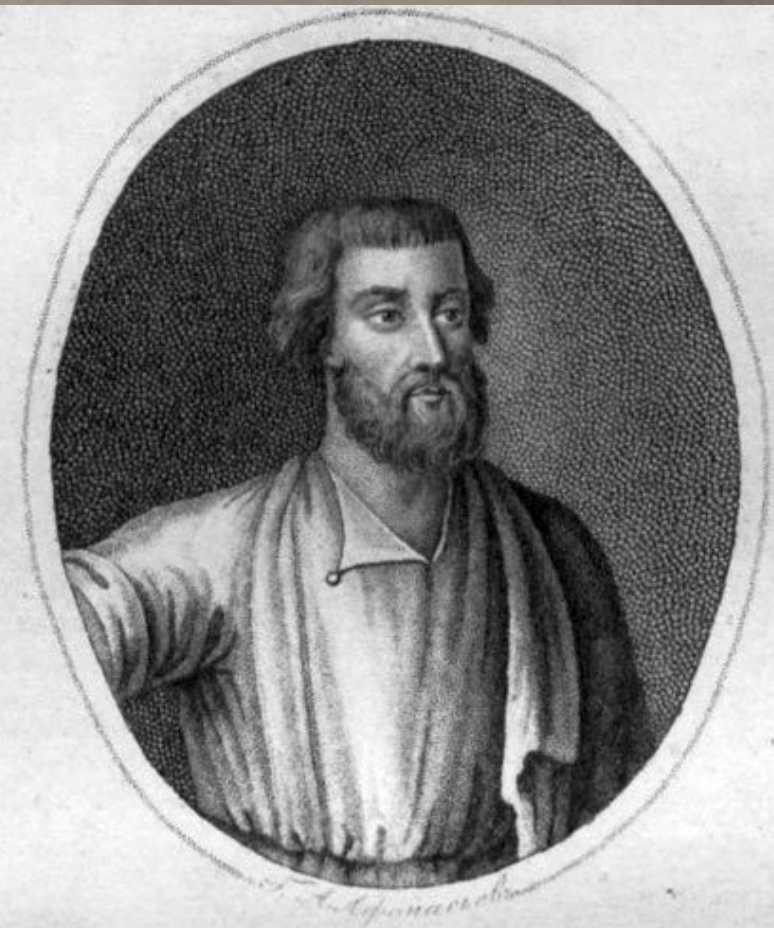
Кузьма Мининъ, Городанинъ Нижегородскій, потомъ Гурный Дворянинъ.

А вот Кузьма Минин. Но это не достоверные первые портреты, что Жанны д'Арк, что Боярыня Морозова, появились через несколько десятилетий после событий, выглядели на самом деле, не знает никто. Уверенности в происхождении Кузьмы Минина известно немного. Нижегородец, горожанин.