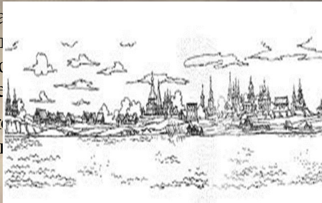
Балахна. Панорама города XVII в.

Имя Космы Минина известно широко организации Нижегородского ополчени загадкой.