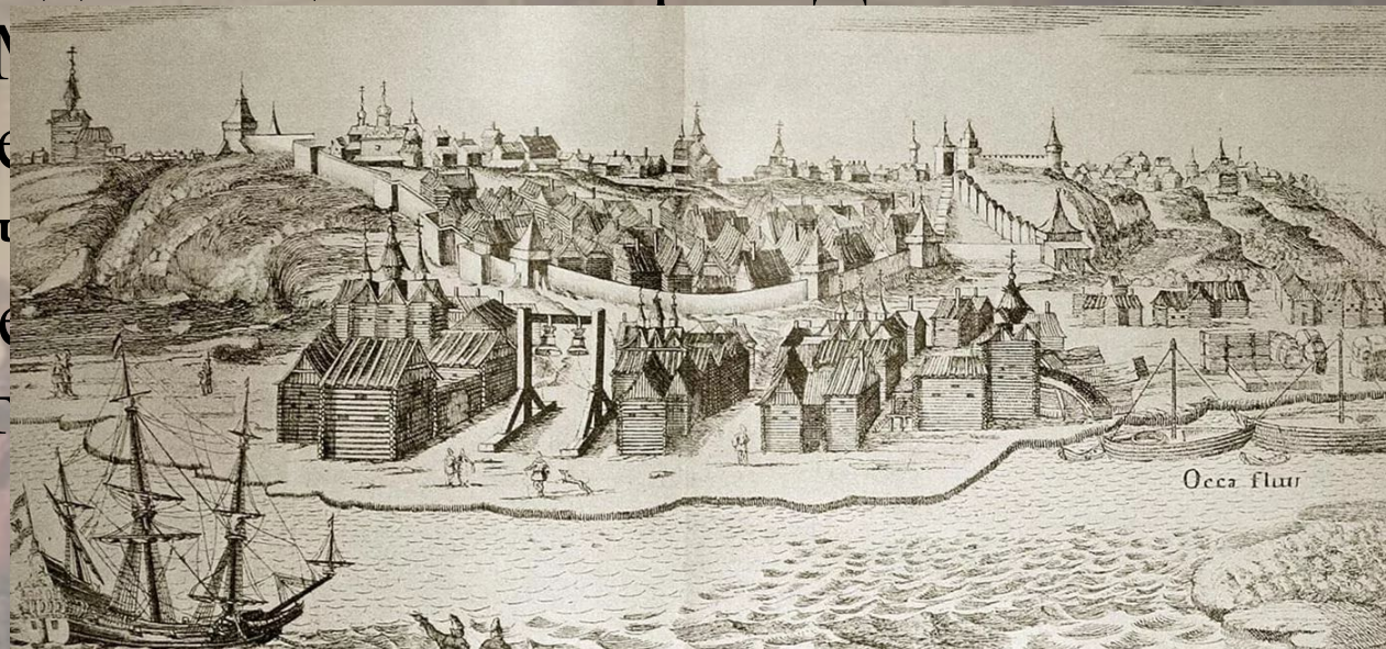
Нижний Новгород в первой половине XVII в.

Косме Минину было около 12 лет, когда с отцом и матерью Доминикой они переехали в Нижний Новгород. Мина на строительство Нижегородского Печорского монастыря. В те годы Косма Минин был уважаемым человеком среди богатых людей в посадской среде благодаря исключительной честностью. Известны его родители Татьяна Семеновна и сына Нефеда.