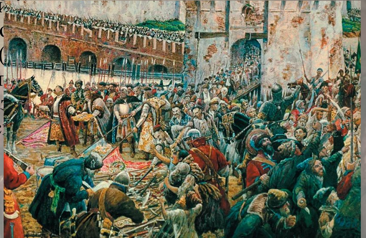
Изгнание поляков из Кремля

После изгнания поляков из Кремля и чтобы не угасала память о чудесном явлении Покрова Пресвятой Богородицы над Отечеством в 1612 г., столь переломным в истории России, было положено ежегодно 22 октября (старый стиль) — день взятия Китай-города и в день казенный — день Казанской Божией Матери. Праздник государственный, церковное, но как церковно-гражданский.