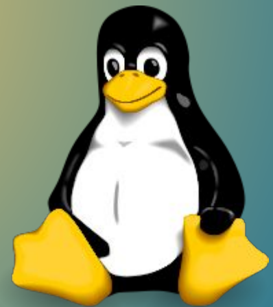
Тух. Логотип Linux