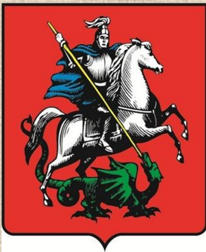
Георгий - Победоносец (г. Москва)