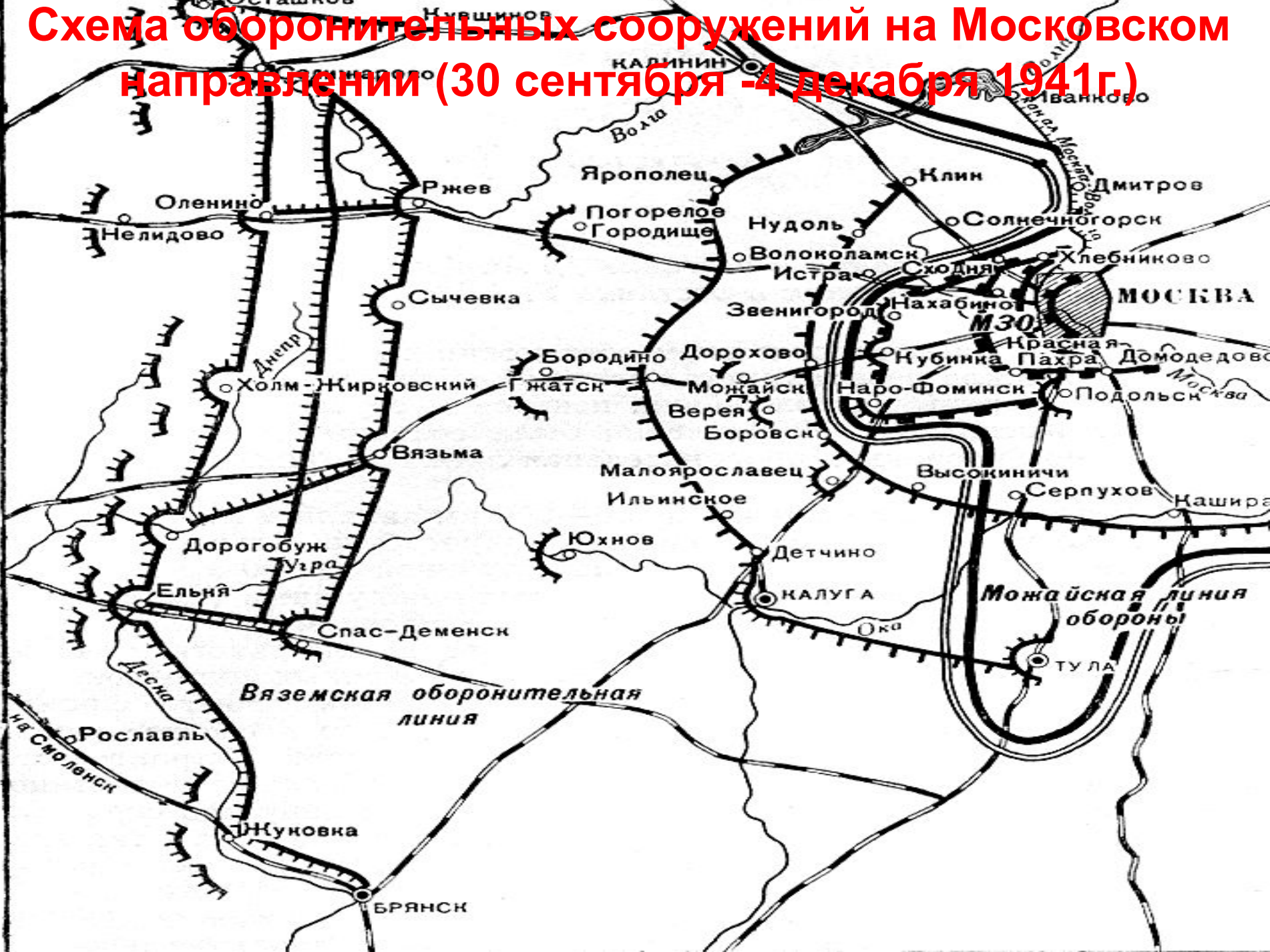
Схема оборонительных сооружений на Московском направлении (30 сентября - 4 декабря 1941 г.)