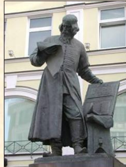
Иван Федоров (Москвитин) Петр Тимофеев Мстиславец