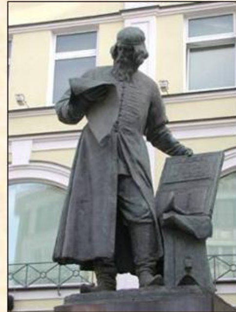
Иван Федоров (Москвитин) Петр Тимофеев Мстиславец