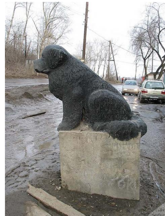
собаке-спасателю (г. Нью-Йорк)