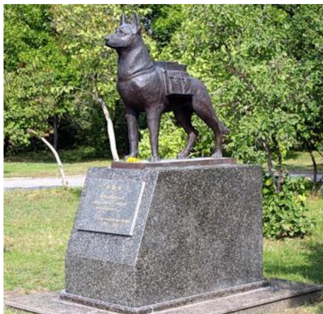
собакам-подрывникам (г. Волгоград)