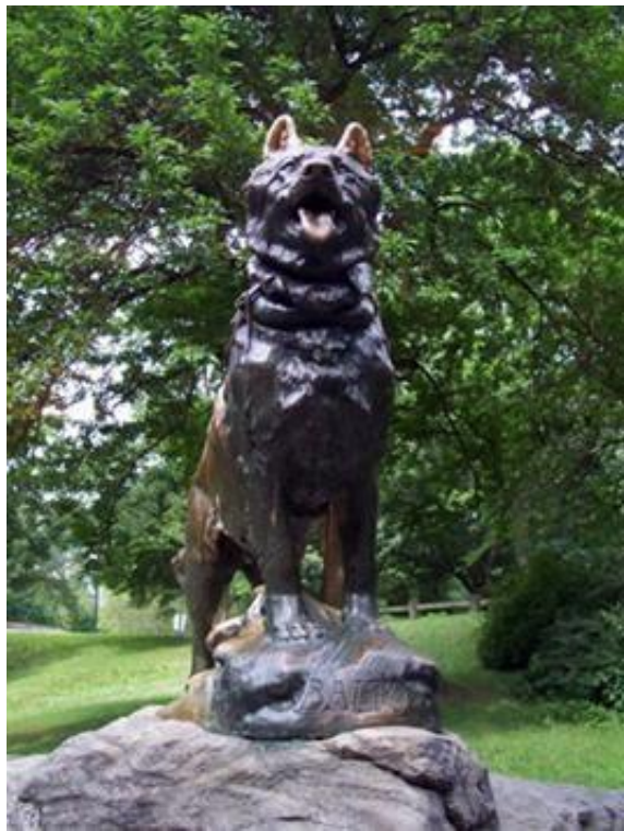
собакам-военным (г. Пермь)