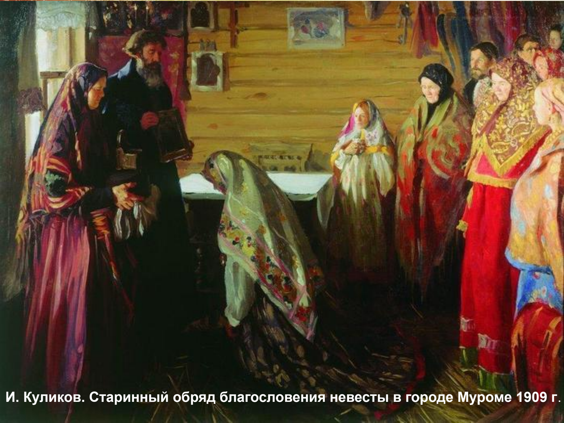
И. Куликов. Старинный обряд благословения невесты в городе Муроме 1909 г.