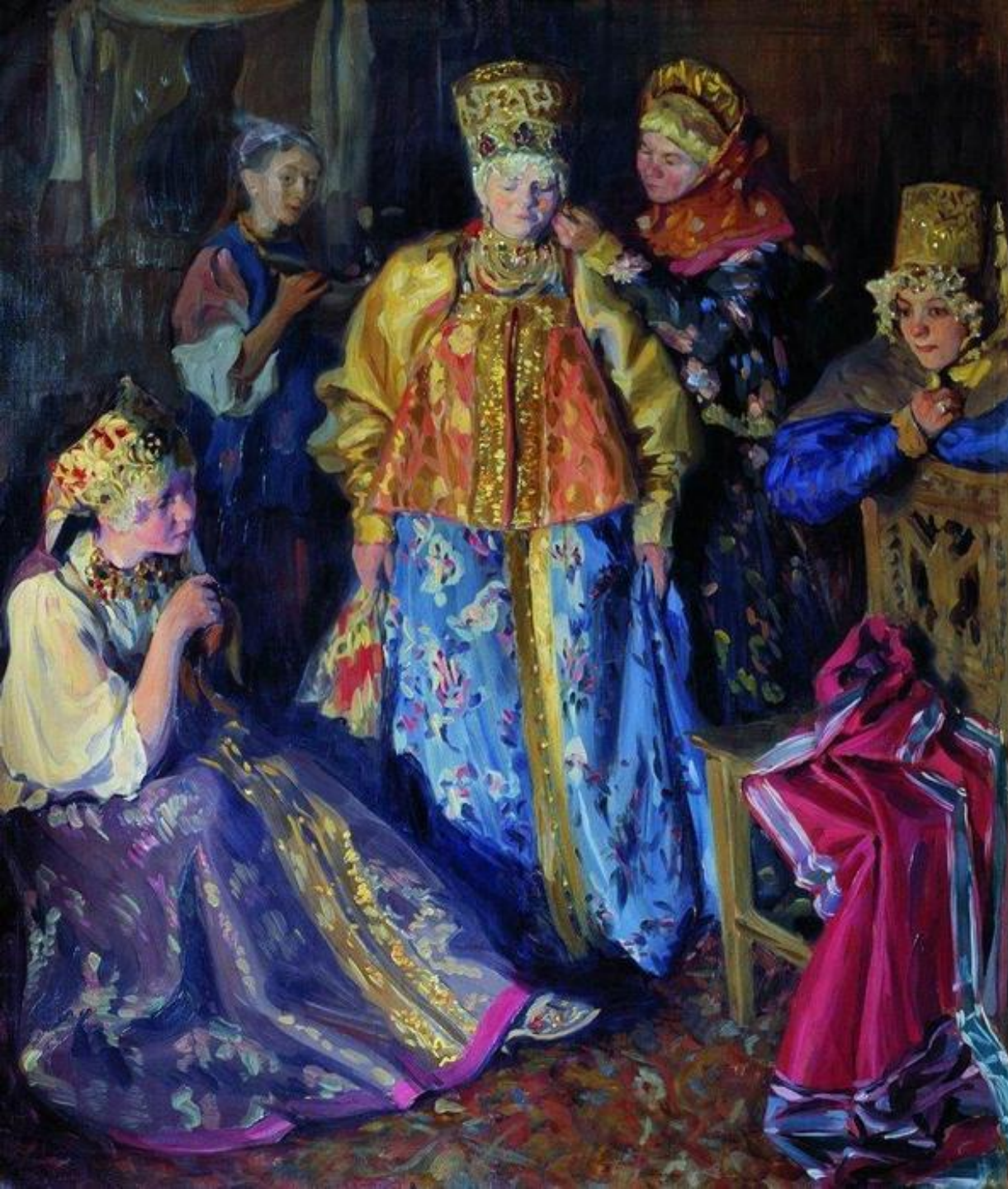
Иван Куликов Убор невесты 1907 г.