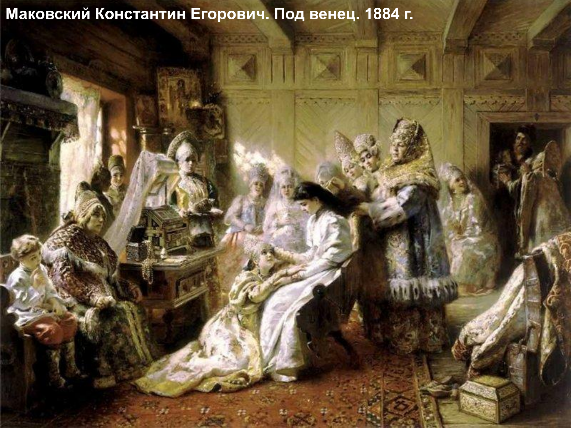
Маковский Константин Егорович. Под венец. 1884 г.