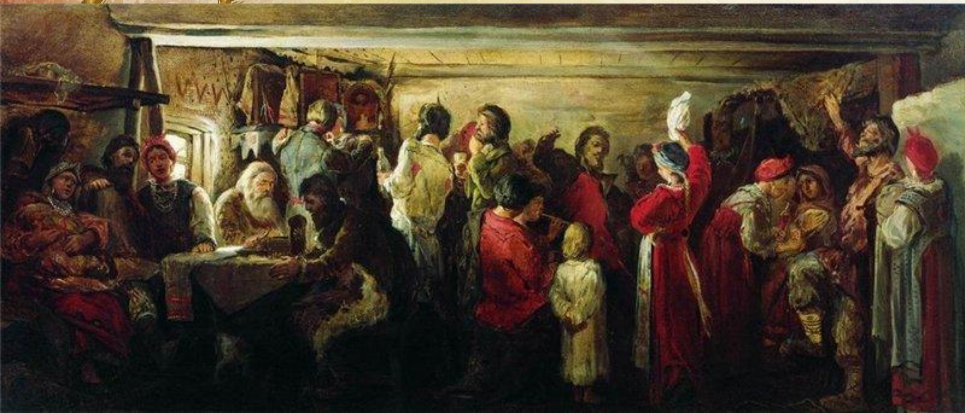
Рябушкин А.П. Крестьянская свадьба в Тамбовской губернии.