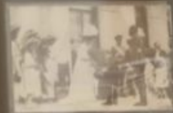
Император Александр Второй и Императрица Мария Александровна в Севастополе Император Александр Второй и Императрица Мария Александровна в Севастополе