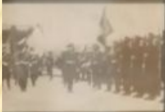
Император Александр Второй и Императрица Мария Александровна в Севастополе Император Александр Второй и Императрица Мария Александровна в Севастополе Emperor Alexander II and Empress Maria Alexandrovna in Sevastopol