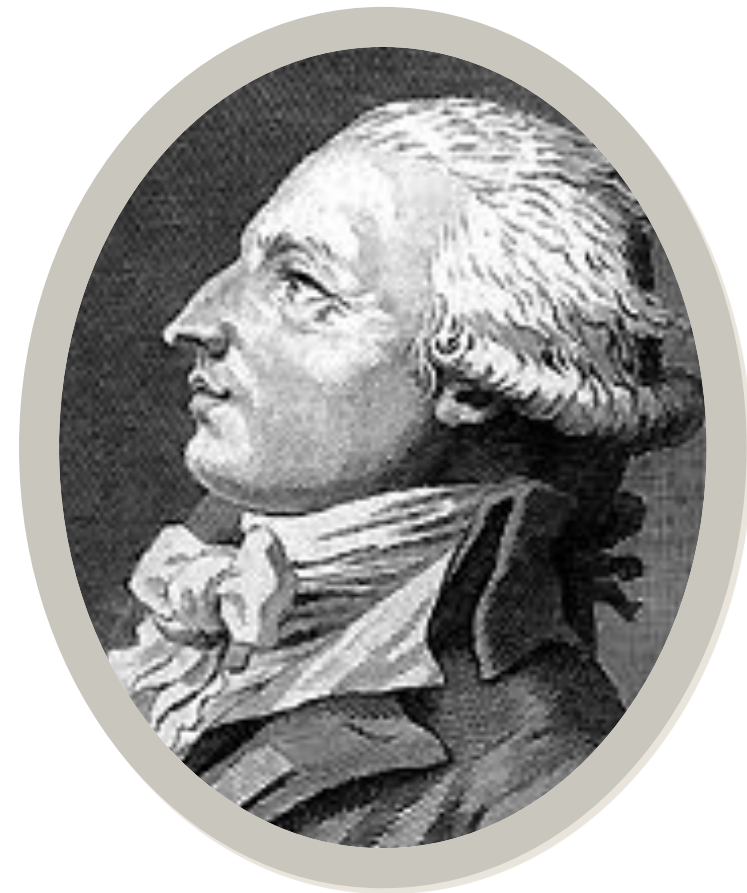
Антуан Луи Клод Дестют де Траси (1754 — 1836)

Видный французский философ, политик и экономист. Ввел в употребление термин «идеология». Согласно его взглядам, идеология есть наука о том, как сознание производит идеи из ощущений. Помимо ощущений, источником идей выступает память, способность к суждению и воля. Основы науки об идеях французский философ изложил в своем труде «Элементы идеологии».