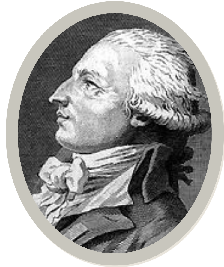
Антуан Луи Клод Дестют де Траси (1754 — 1836)

Видный французский философ, политик и экономист. Ввел в употребление термин «идеология». Согласно его взглядам, идеология есть наука о том, как сознание производит идеи из ощущений. Помимо ощущений, источником идей выступает память, способность к суждению и воля. Основы науки об идеях французский философ изложил в своем труде «Элементы идеологии».