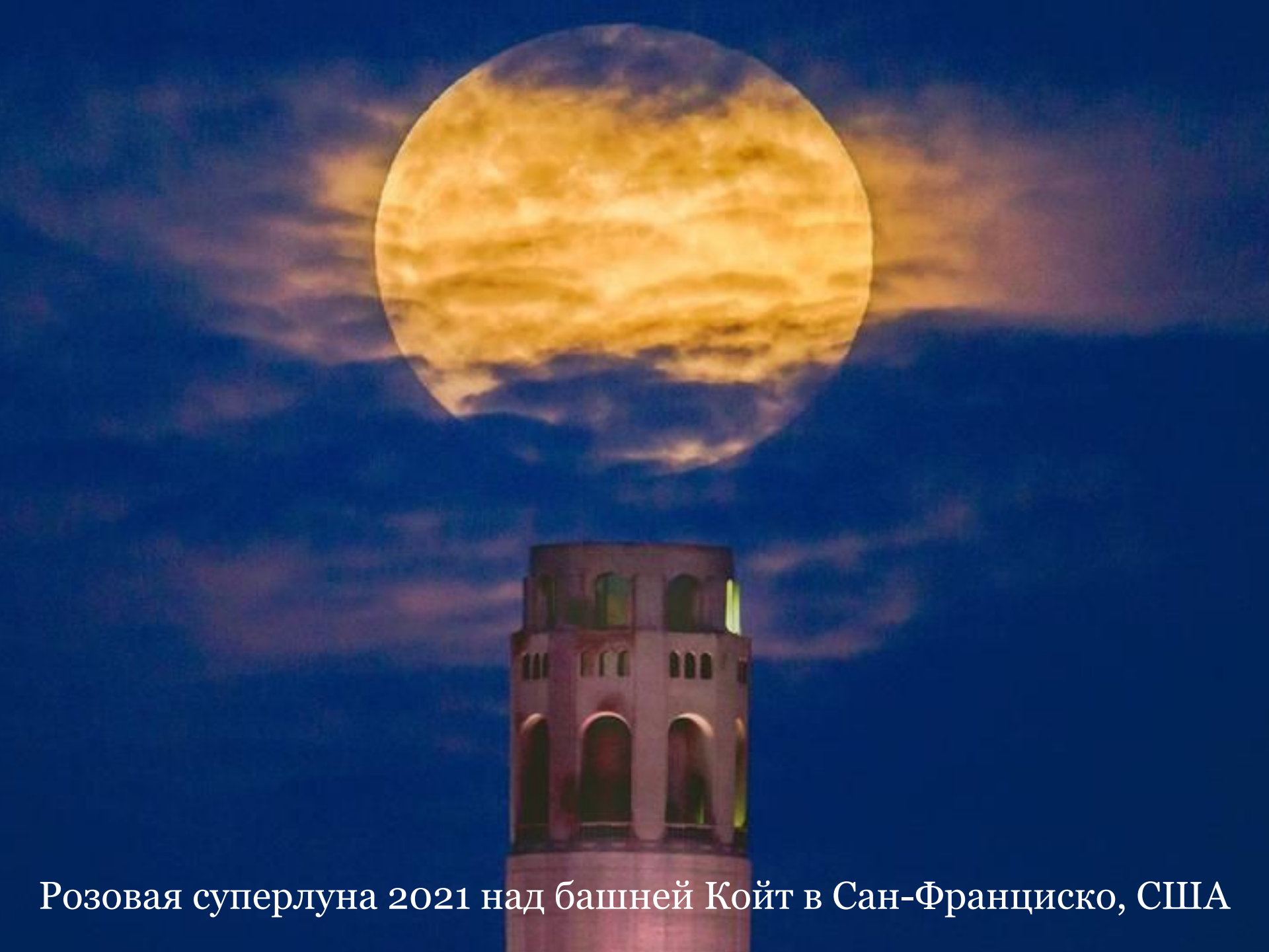
Розовая суперлуна 2021 над башней Койт в Сан-Франциско, США