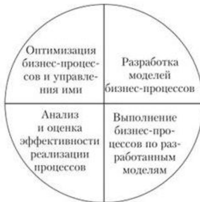
Цикл управления бизнес-процессами

После последнего четвертого шага, в целях непрерывного улучшения деятельности компании должен снова следовать первый шаг.