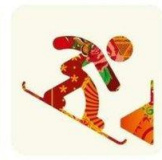
Сноуборд параллельные виды