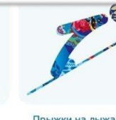
Прыжки на лыжах с трамплина