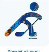
Хоккей на льду