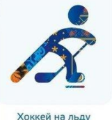
Хоккей на льду