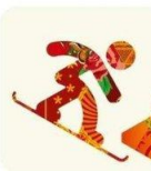
Сноуборд параллельные виды