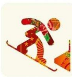
Сноуборд параллельные виды