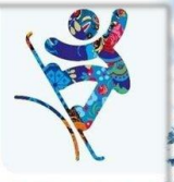
Сноуборд - Слоупстайл