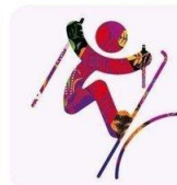
Фристайл - Слоупстайл