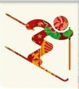
Фристайл - Могул