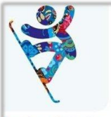
Сноуборд - Хафпайп