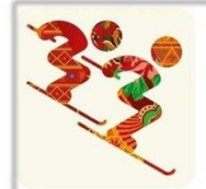
Фристайл - Ски-кросс