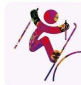
Фристайл - Слоупстайл