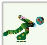
Скоростной бег на коньках