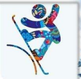
Сноуборд - Слоупстайл