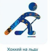
Хоккей на льду