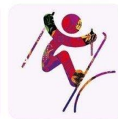
Фристайл - Слоупстайл