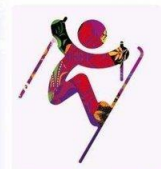
Фристайл - Хафпайп