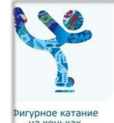
Фигурное катание на коньках