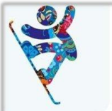
Сноуборд - Хафпайп