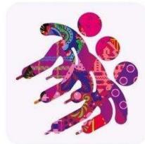
Шорт - трек