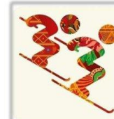
Фристайл - Ски-кросс