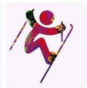
Фристайл - Хафпайп