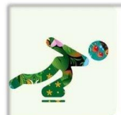
Скоростной бег на коньках