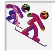
Сноуборд - кросс