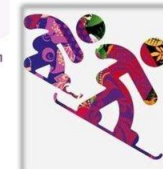
Сноуборд - кросс