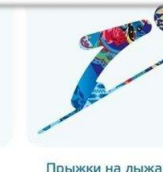
Прыжки на лыжах с трамплина