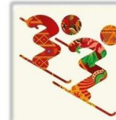
Фристайл - Ски-кросс