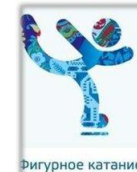
Фигурное катание на коньках