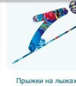
Прыжки на лыжах с трамплина