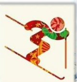
Фристайл - Могул