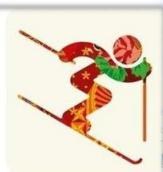
Фристайл - Могул