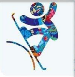
Сноуборд - Слоупстайл