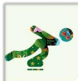
Скоростной бег на коньках