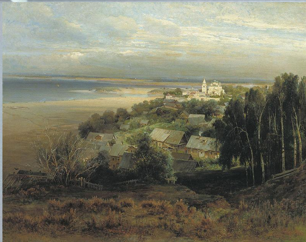
«Печёрский монастырь под Нижним Новгородом»