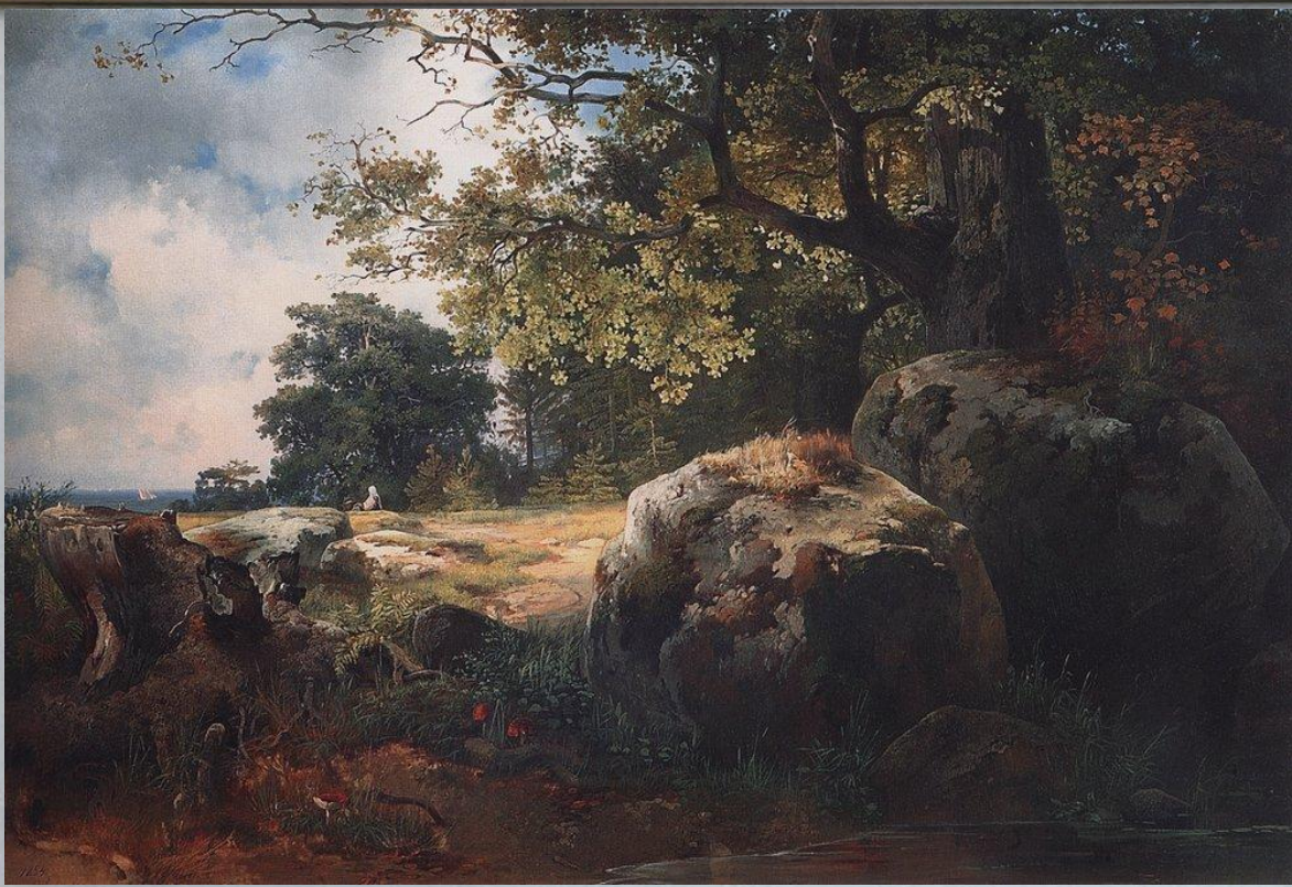
«Вид в окрестностях Ораниенбаума»