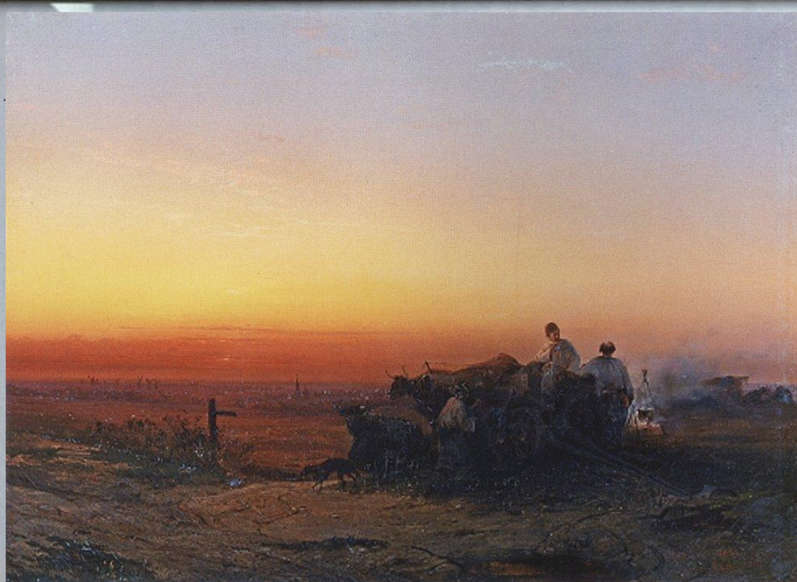
«Степь с чумаками вечером»