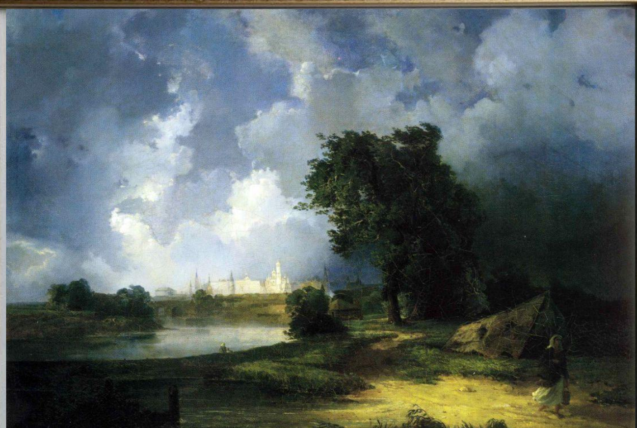
«Вид на Кремль от Крымского моста в ненастную погоду»