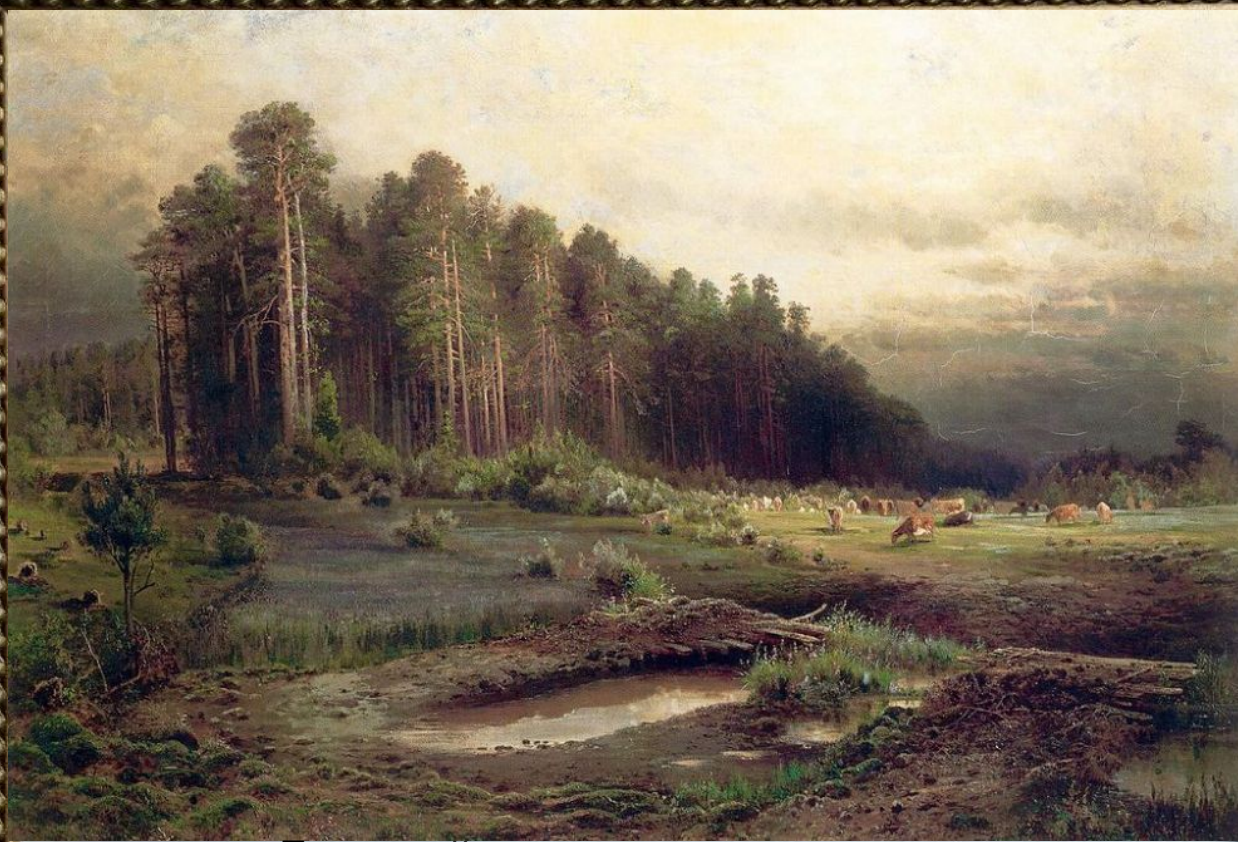
«Лосиный остров в Сокольническом»