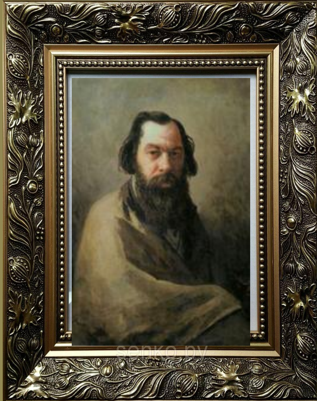
Алексей Кондратьевич Саврасов 1830 - 1897