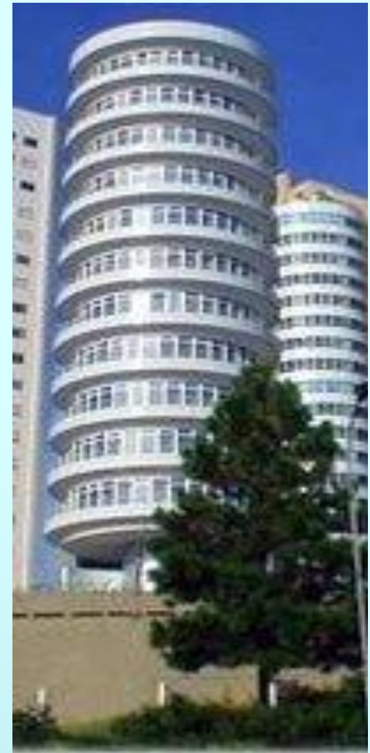
Вращающийся дом в Куритиба (Бразилия)