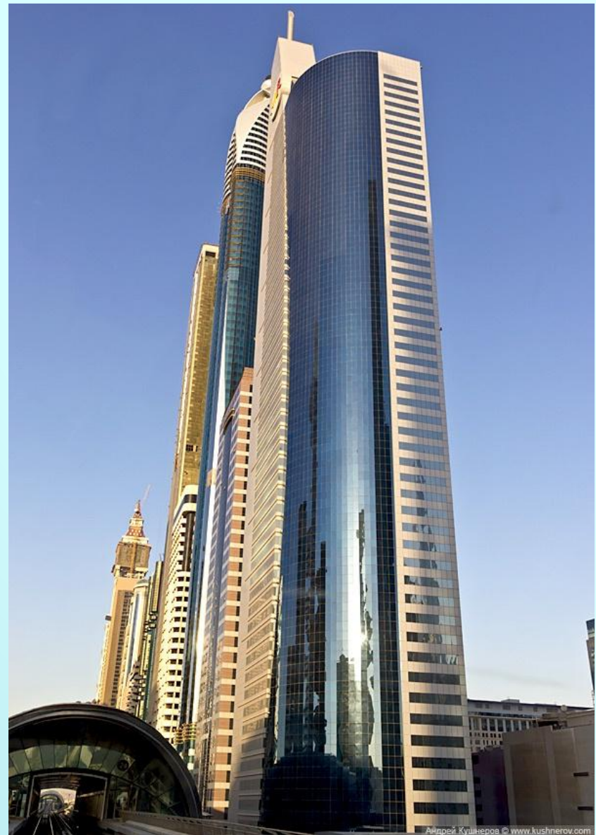
Дубай - небоскрёбы на шоссе шейха Зайда

Архитектура современности — ЭТО ВО МНОГОМ отрицание канонов прошлого. Невозможно «одеть» современные здания, предназначенные для новых целей, в архитектурные формы прошлого.