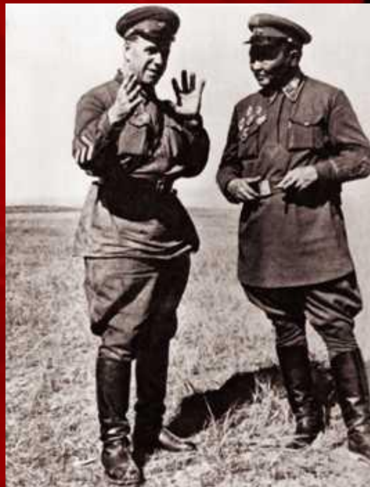
Жуков и Маршал Чойбалсан, Халхин-Гол.