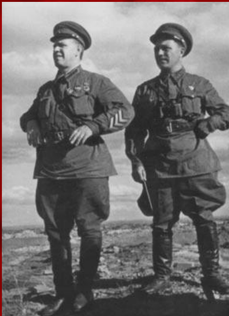
Г.К. Жуков. Халхин-Гол.