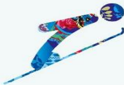
Прыжки с трамплина