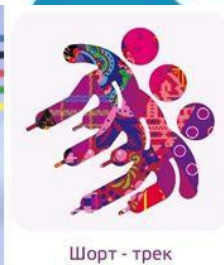
Шорт - трек

Шорт-трек - вид конькобежного спорта. В соревнованиях несколько спортсменов (как правило 4—8: чем больше дистанция, тем больше спортсменов в забеге) одновременно катаются по овальной ледовой дорожке длиной 111,12 м.