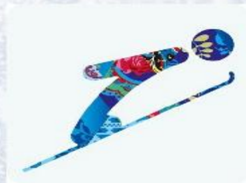
Прыжки с трамплина