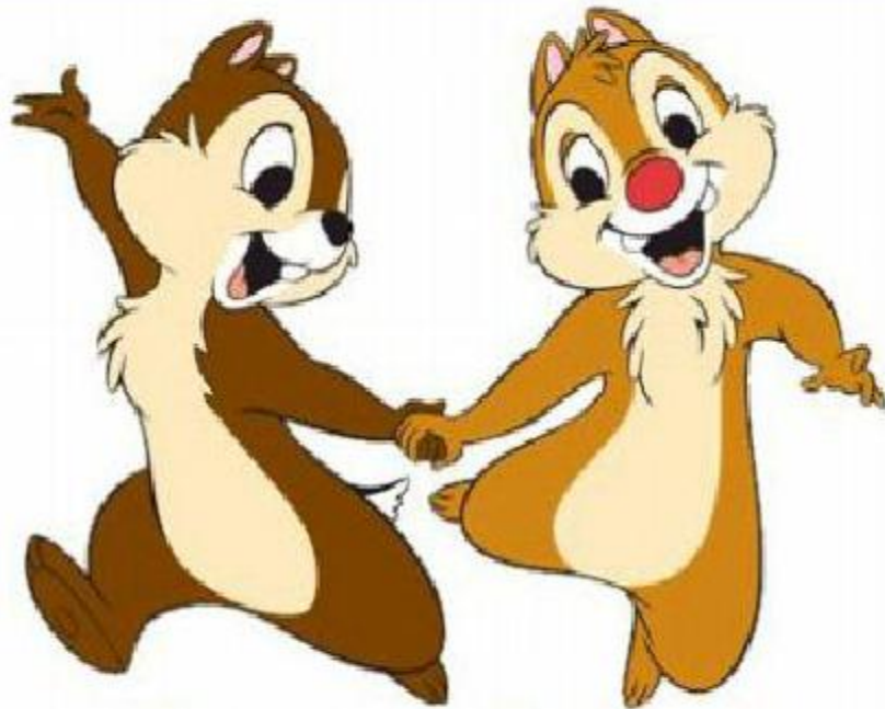
Chip and Dale