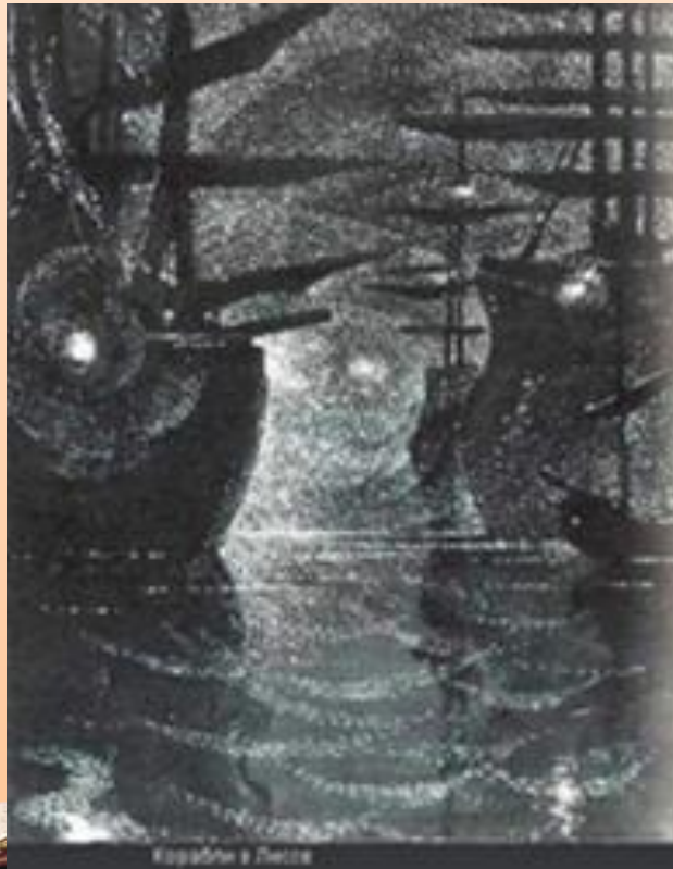
С.Бродский. Корабли Лисса