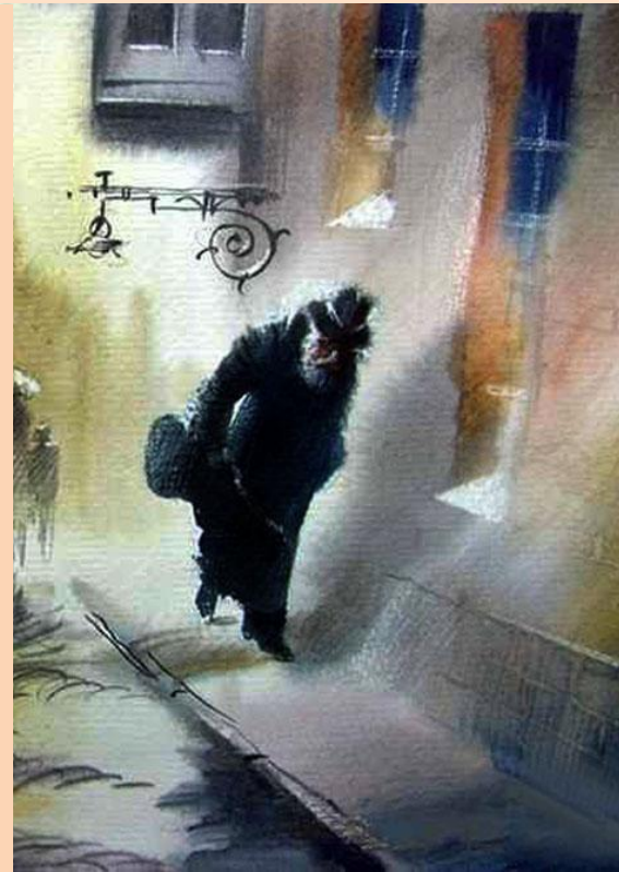
Возвращение скрипача домой