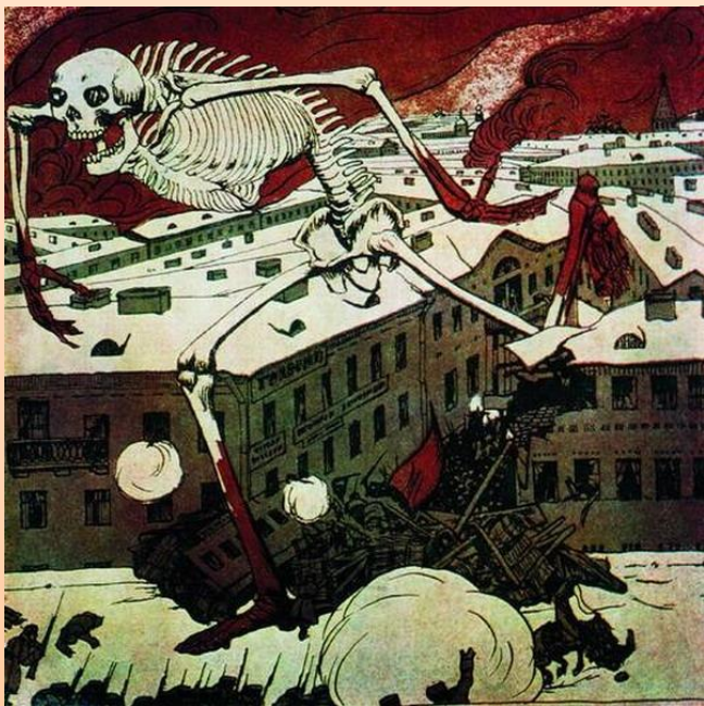
Б.Кустодиев. Вступление. 1906 год.