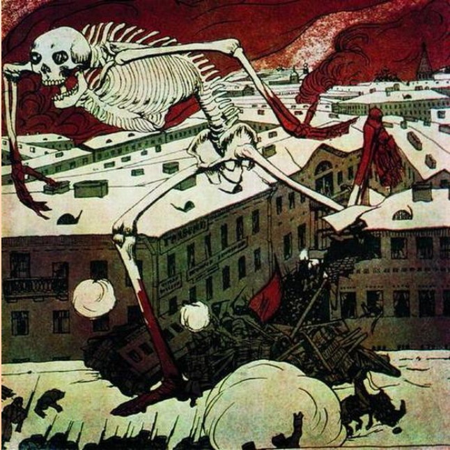
Б.Кустодиев. Вступление. 1906 год.