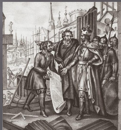
Великий князь Ярослав после разорения татарами России возобновляет города. Гравюра Б. Чорикова