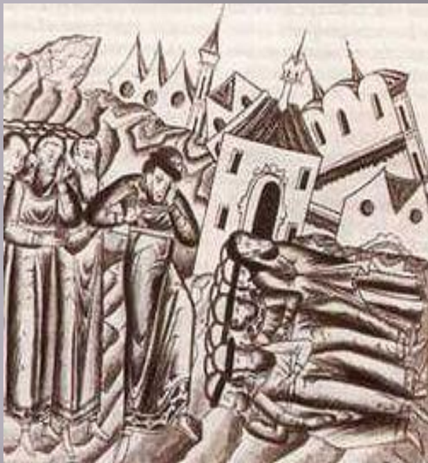
Возвращение князя Ярослава Всеволодовича во Владимир после нашествия Батыея. Миниатюра из 'Казанского летописца'. XVI в.