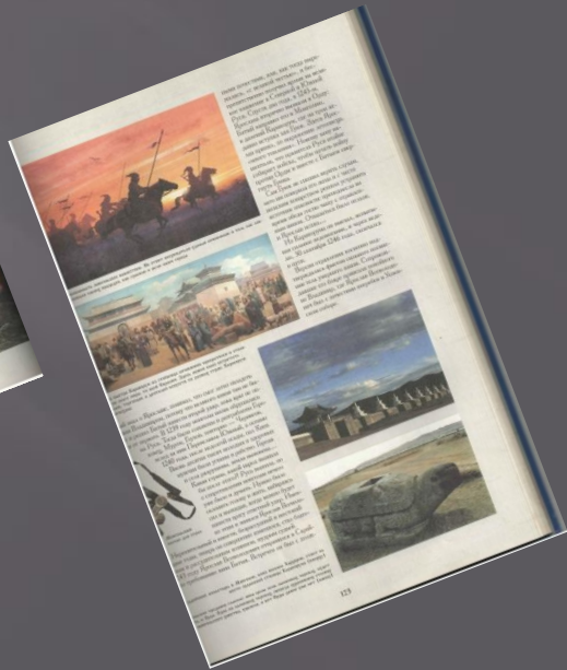
Калашников В.И. Владимирская Русь/ Русь Легендарная. Книга 3. – М.: Белый город. – 224с.: ил.