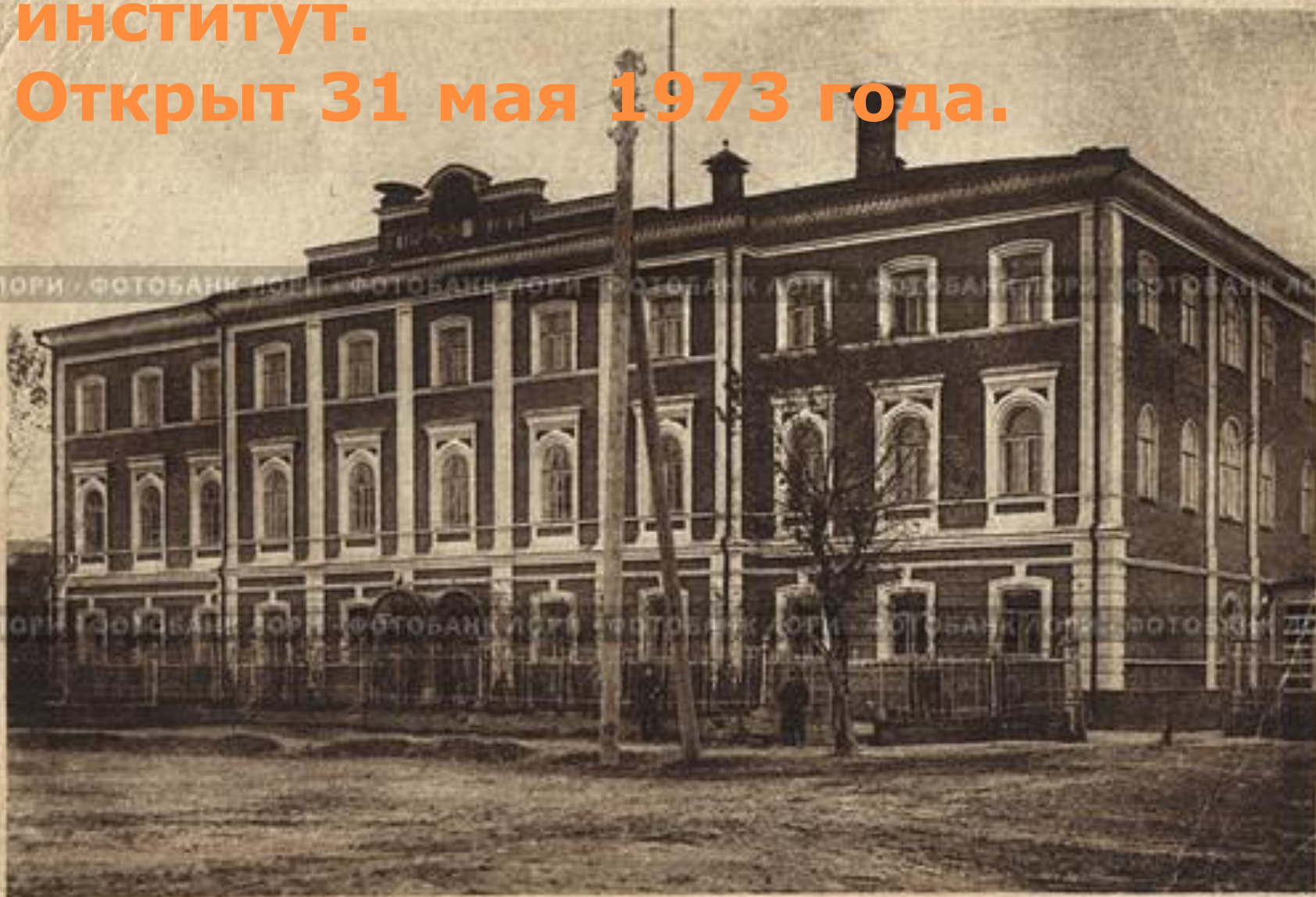
Старая открытка. Казань. Ветеринарный институт