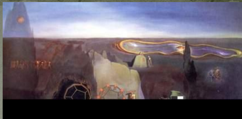
В поисках четвёртого измерения 1979г.