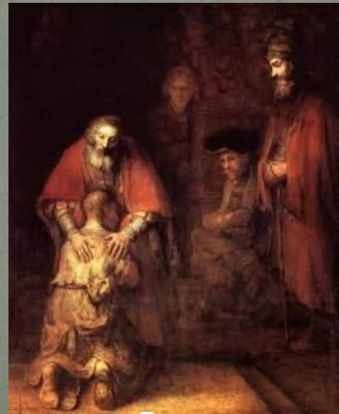
Возвращение Блудного Сына 1669 г.