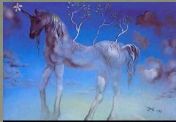
Весёлый единорог 1977г.