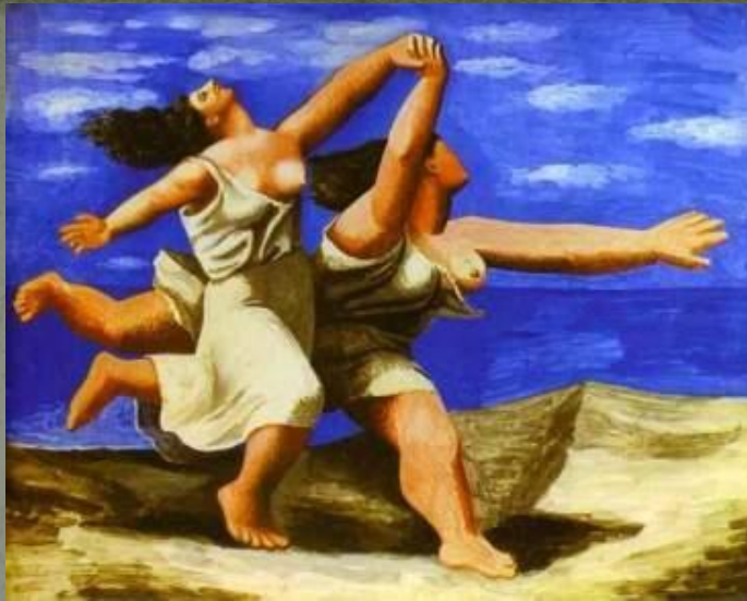
девушки бегущие по берегу

В 1920-х гг. Пикассо пишет некоторые из своих наиболее известных, классических работ, отчасти навеянных впечатлениями от поездки в Италию. В это время он продолжает экспериментировать, обнаруживая близость с сюрреализмом. Начиная с 1925 г. Пикассо создаёт выразительные работы, написанные в резкой, неистовой манере. Кульминацией стала самая известная живописная работа художника - "Герника", (1937 г.), отразившая ужас и мерзость войны.