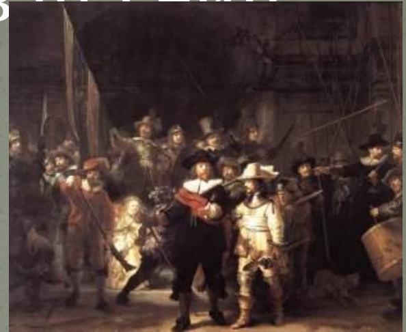
Ночной дозор 1642 г

Рембрандт Харменс ван Рейн (Rembrandt Harmensz van Rijn) (1606-1669 гг.) голландский живописец, офортист и рисовальщик, величайший художник Голландии. Родился в семье мельника в Лейдене, где работал примерно до 1632 г., после чего переехал в Амстердам. В 1634 г. Рембрандт женился на девушке из состоятельной семьи Саскии ван Эйленбурх, чей образ был увековечен им на многих портретах с необыкновенной нежностью и любовью. С 1640-х гг., в творчестве Рембрандта, особенно в картинах на религиозные темы, значение приобретает светотень, создающая напряжённую эмоциональную атмосферу. Художника интересует потаённая суть явлений, сложный внутренний мир изображаемых людей. В 1642 г. судьба наносит тяжёлый удар Рембрандту - умирает Саския. В этом же году он пишет своё самое выдающееся и известное полотно "Ночной дозор", композиционное решение которого не имеет ничего общего с традиционным групповым портретом.