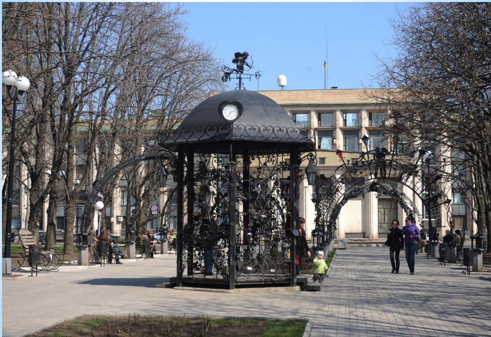
Парк кованых фигур