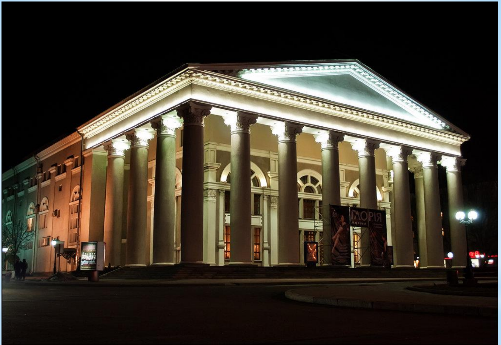
Донецкий музыкально-драматический театр