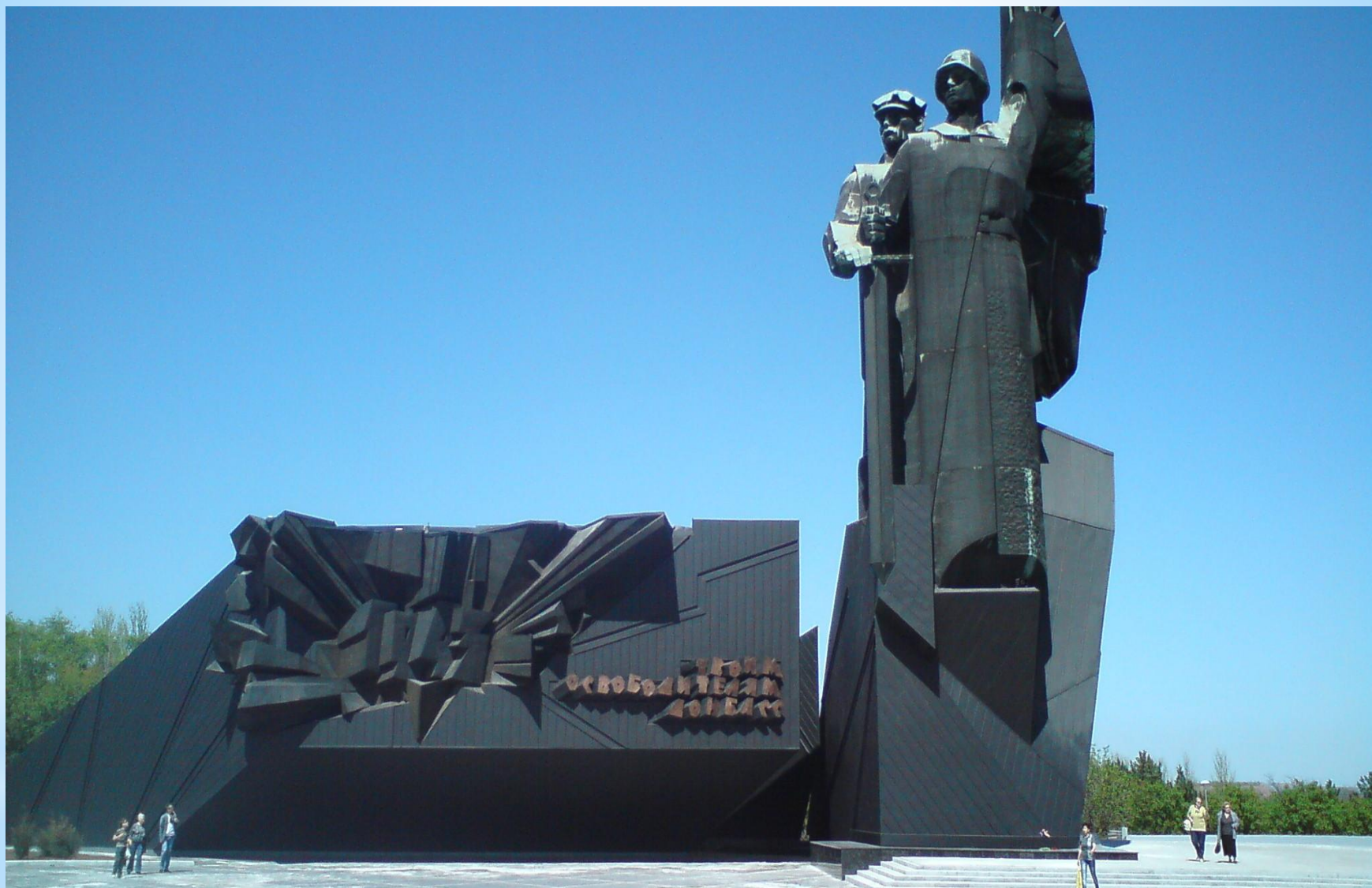
Монумент освободителям Донбасса