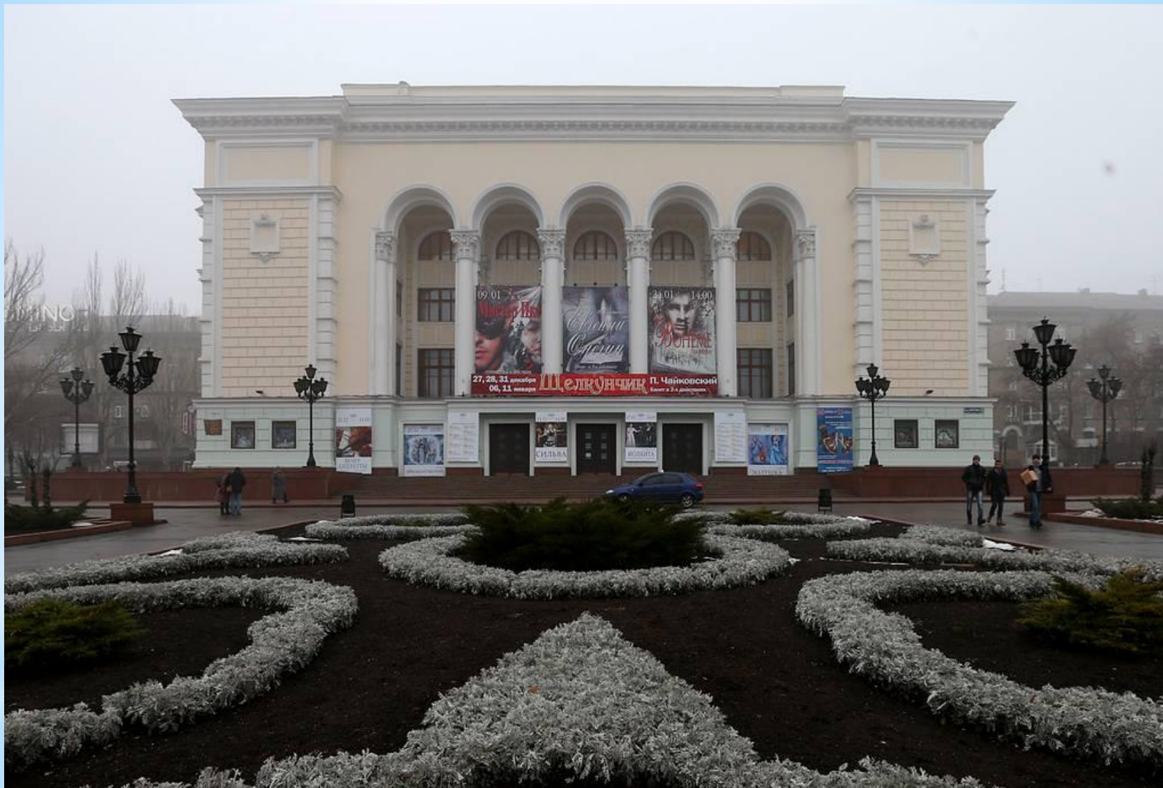
Театр имени А. Соловьяненко