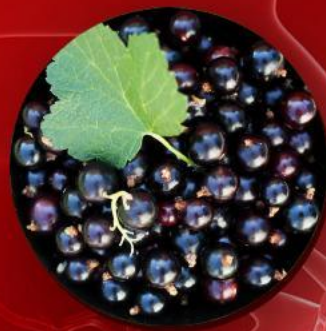
сок черной смородины