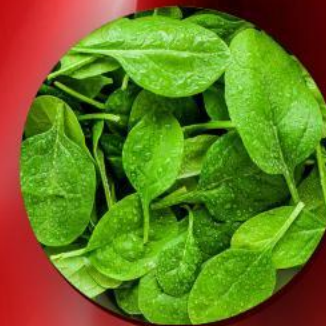
экстракт из шпината