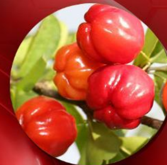
экстракт из плодов ацеролы