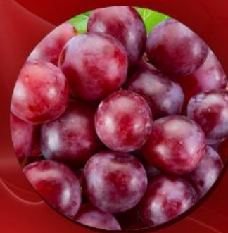
СОК красного винограда