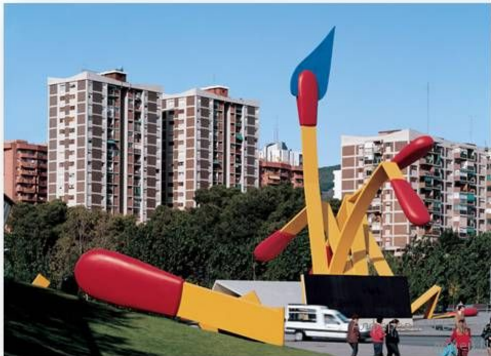
Памятник спичкам в Барселоне.