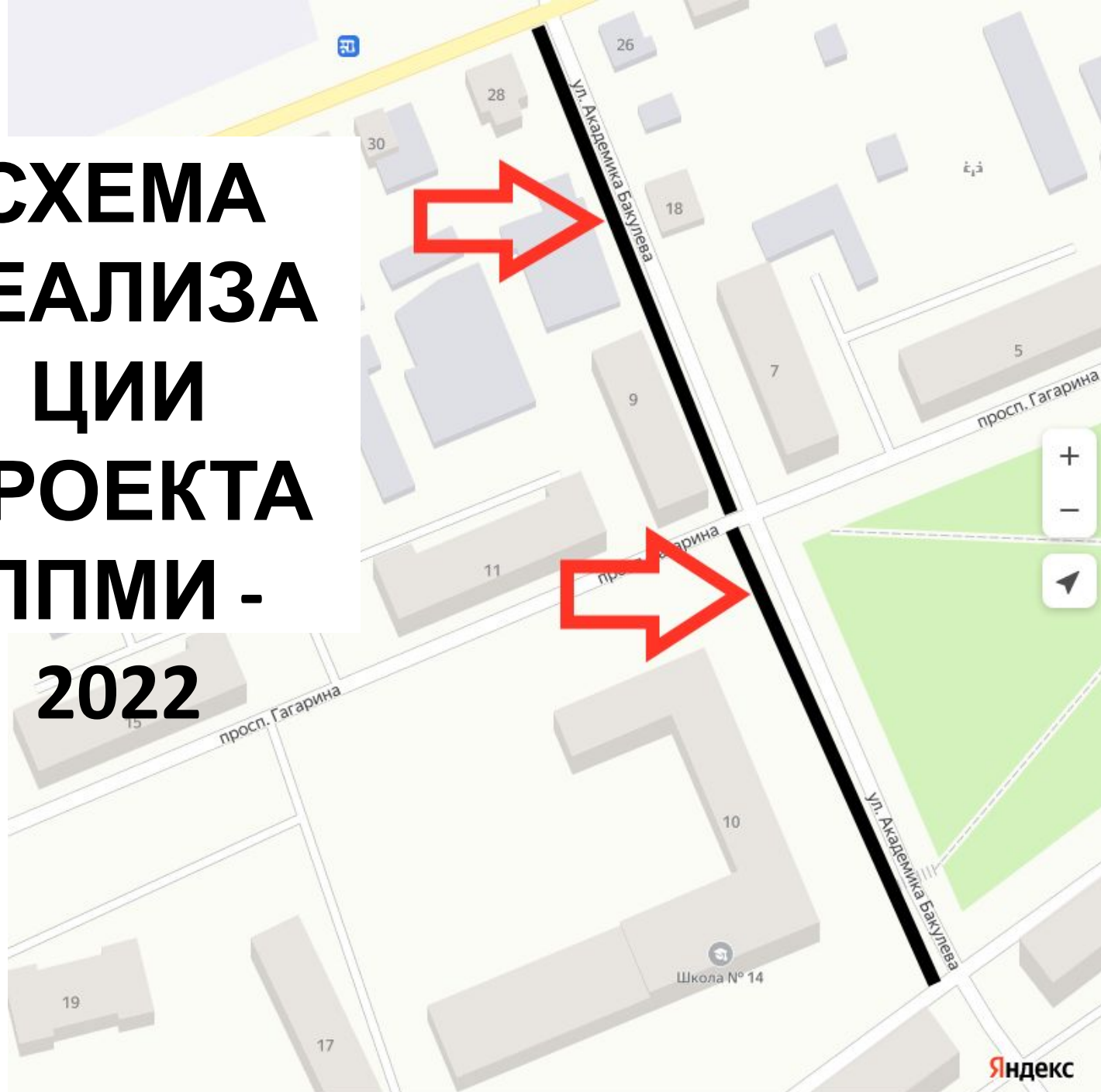
СХЕМА РЕАЛИЗАЦИИ ПРОЕКТА ППМИ - 2022