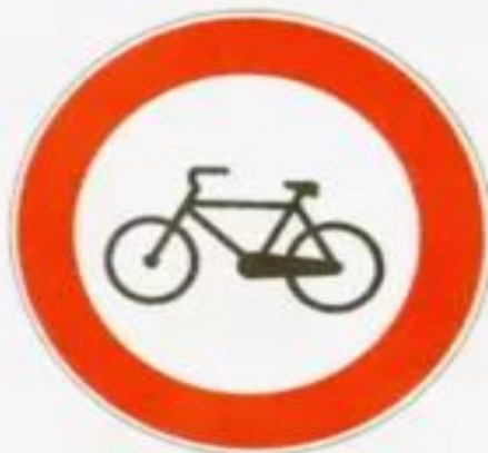
Движение на велосипедах запрещено