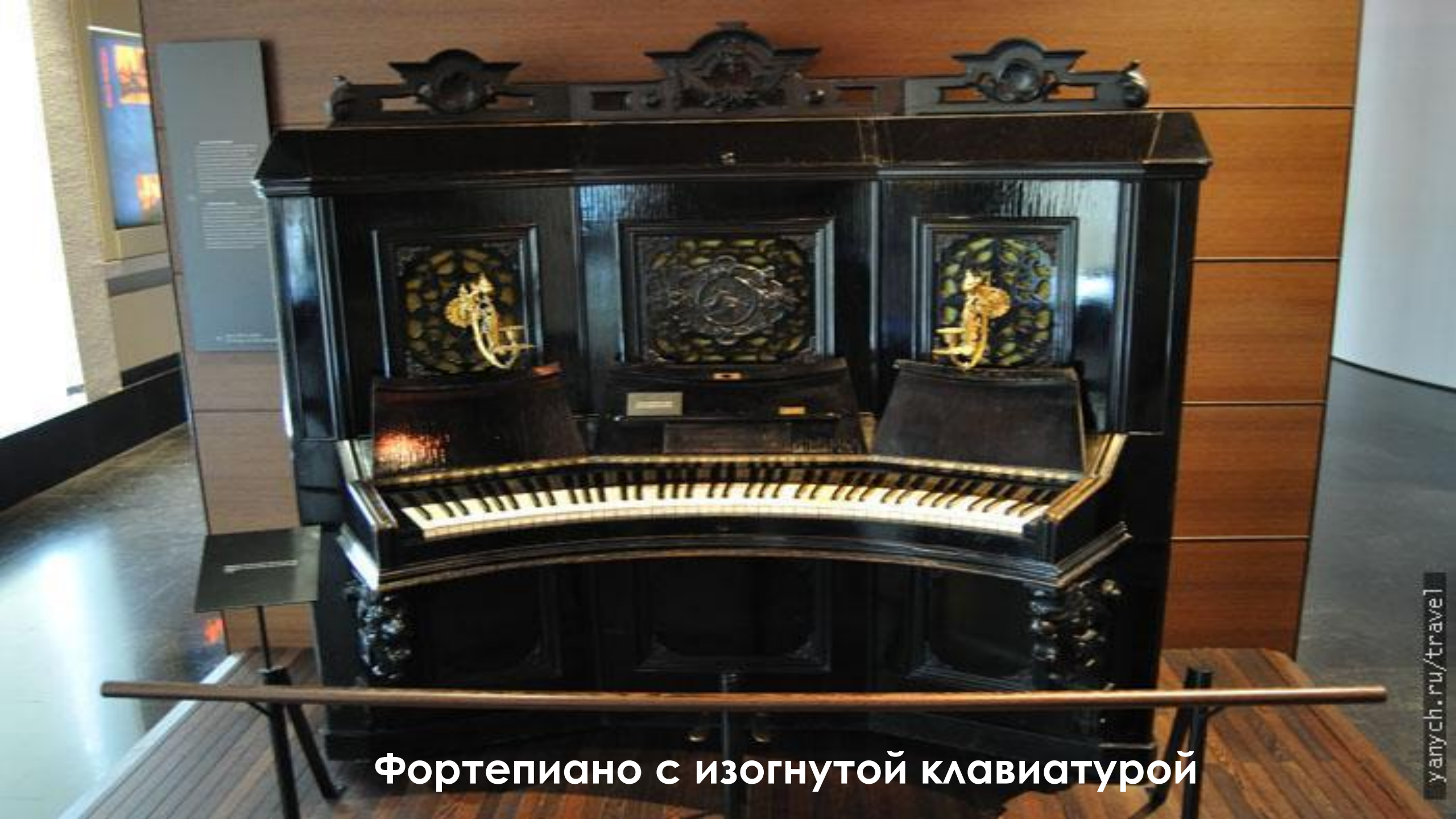
Фортепиано с изогнутой клавиатурой