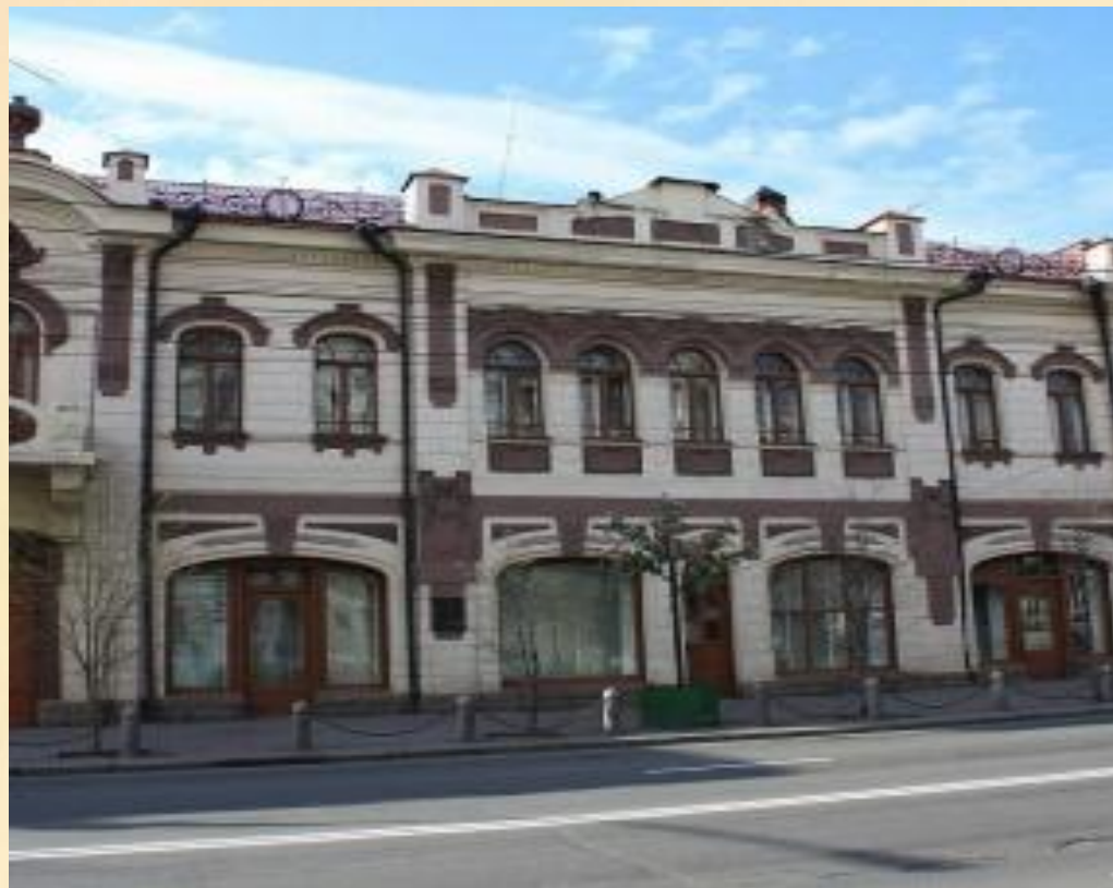
Здание - сейчас