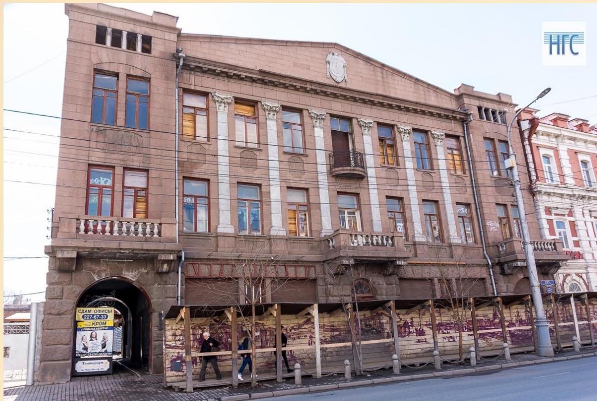
Торговый дом фирмы "Ревильон-братья" - 2020г.