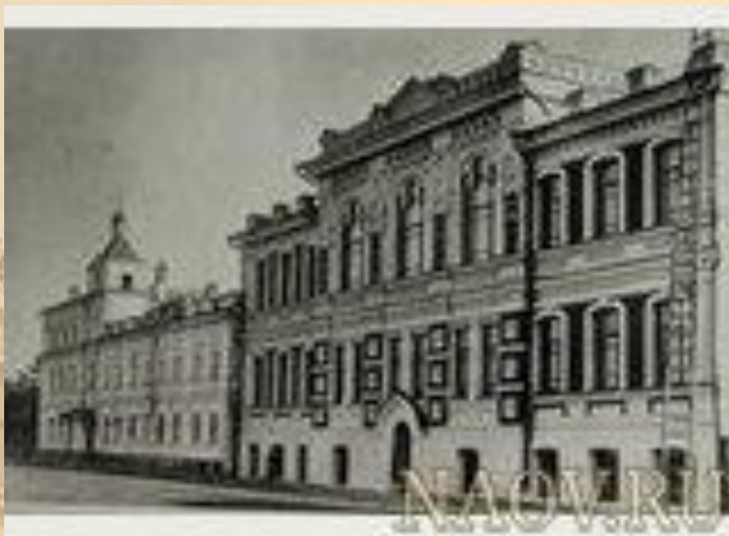
Женское Епархиальное училище в Красноярске в начале XX века