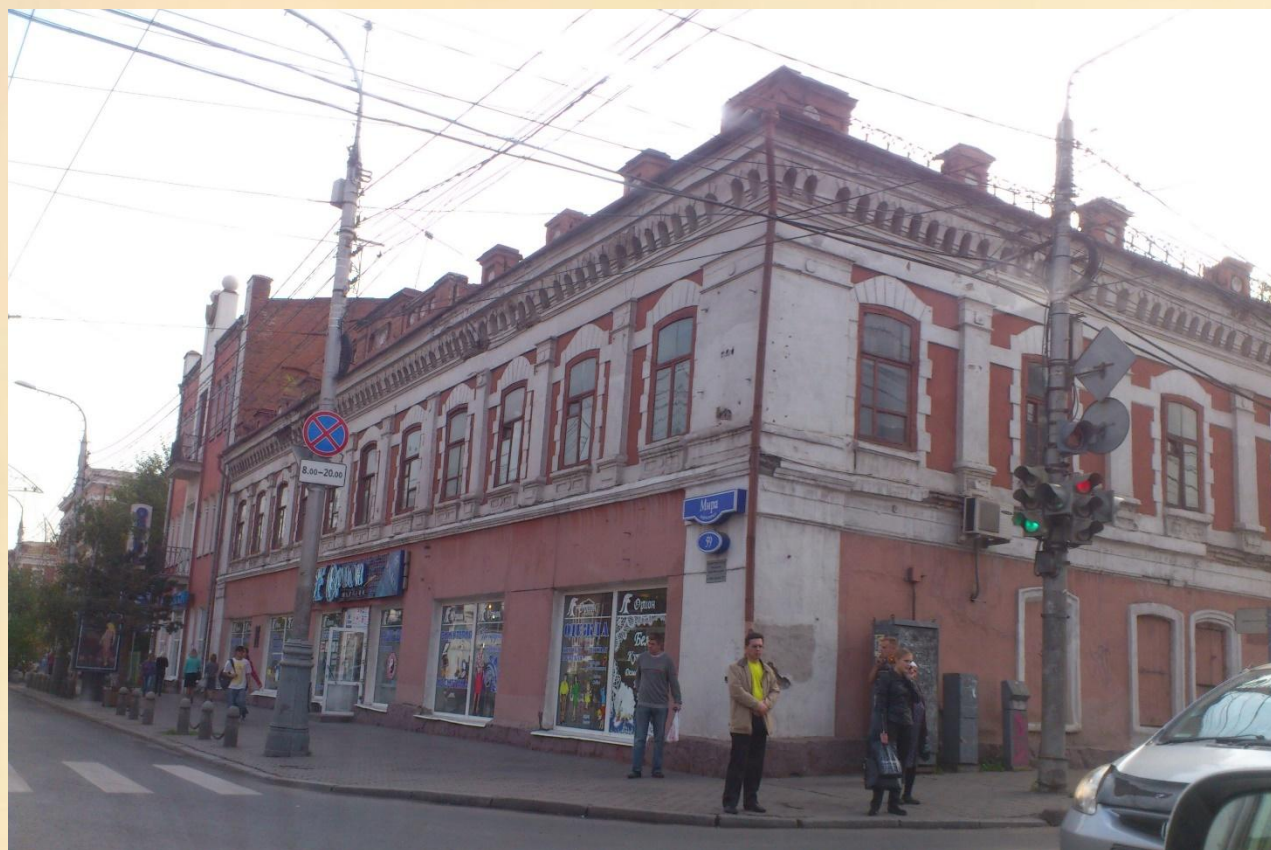
Торговый дом «А.А.Смирнов и сыновья» в наше время