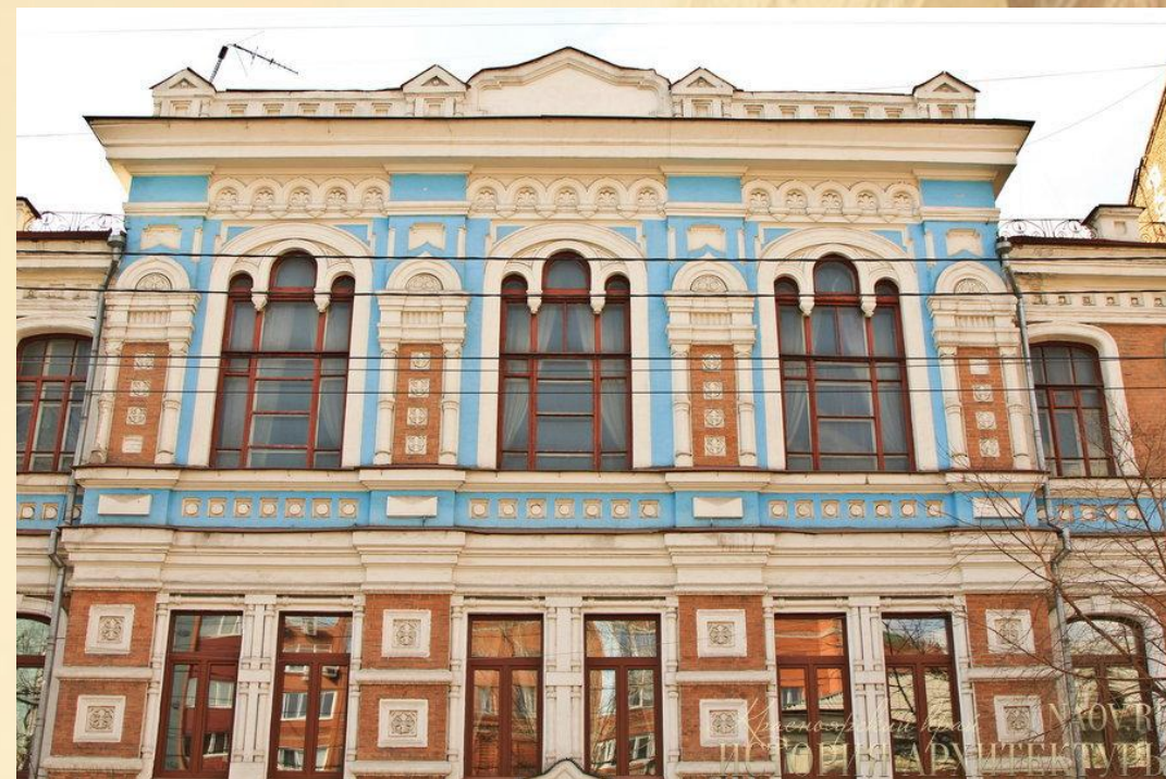
Женское Епархиальное училище – наше время