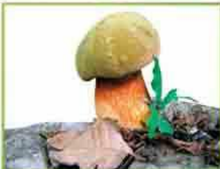
белый гриб (дубовый)