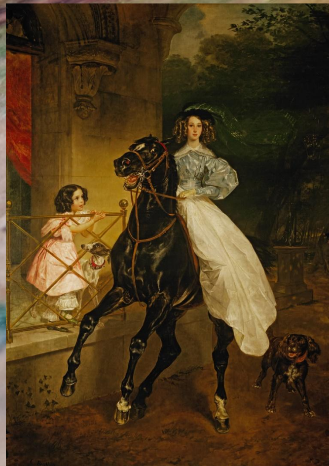
Карл Брюллов, «Всадница»