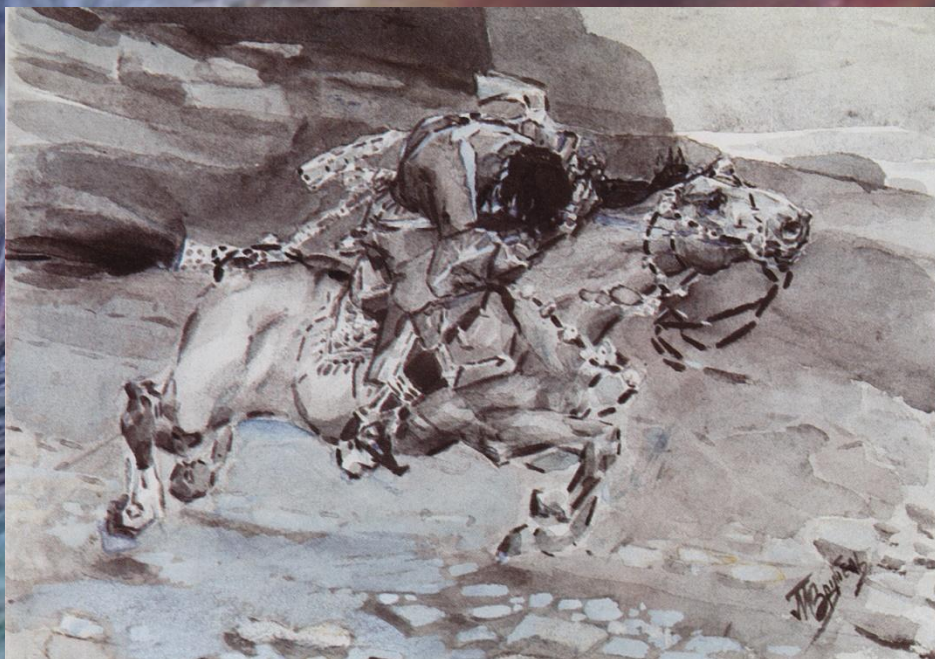
Михаил Врубель, «Всадник»