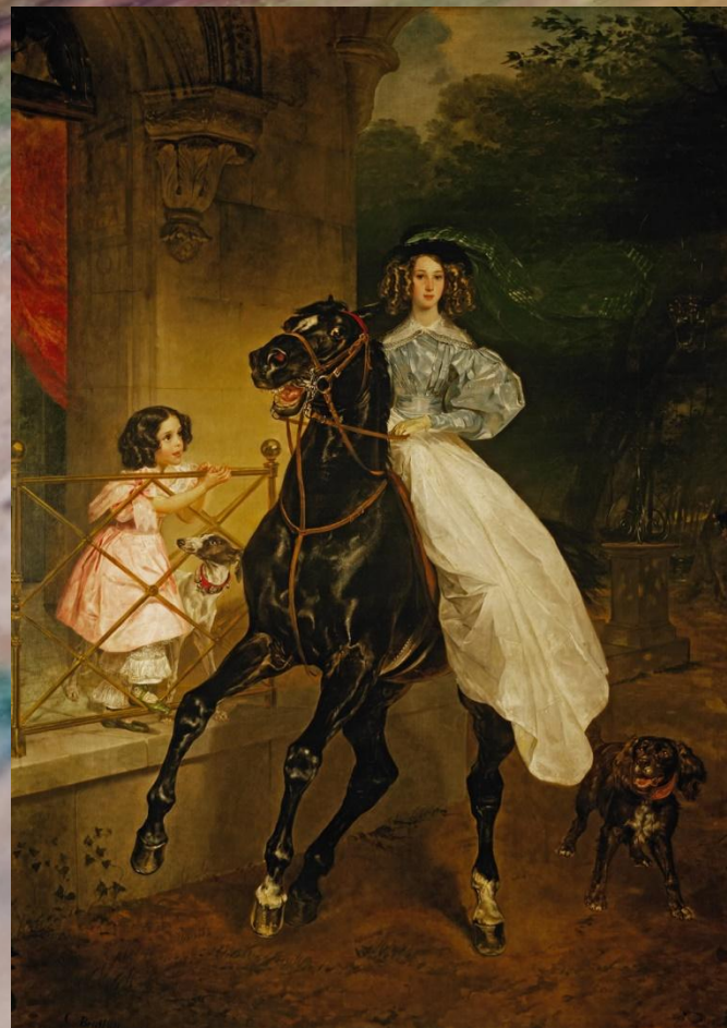
Карл Брюллов, «Всадница»