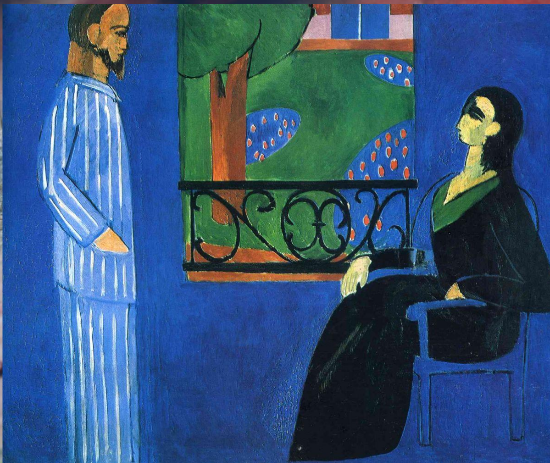
Анри Матисс, «Диалог»

«Произведения искусства <...> обращаются к человеку тет-а-тет, вступая с ним в прямые, без посредников, отношения».