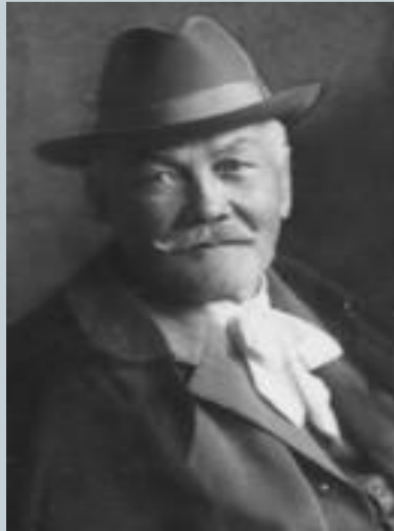
Павол Орсаг Гвездослав