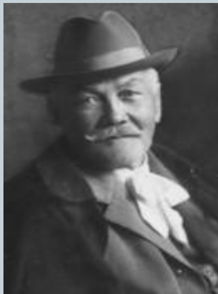
Павол Орсаг Гвездослав