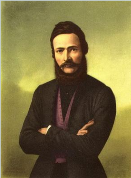
Людовит Велислав Штур