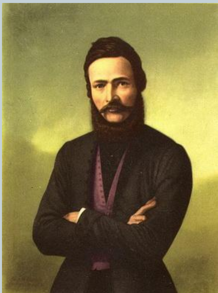
Людовит Велислав Штур