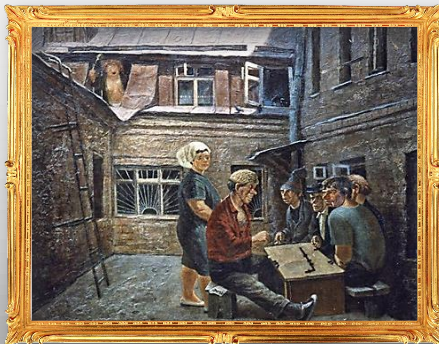
Домино. 1984 г.

Во времена СССР мужики часто часами просиживали во дворе, играя в домино, карты и другие бессмысленные игры, не обращая внимания на свою семью и домашнее хозяйство.