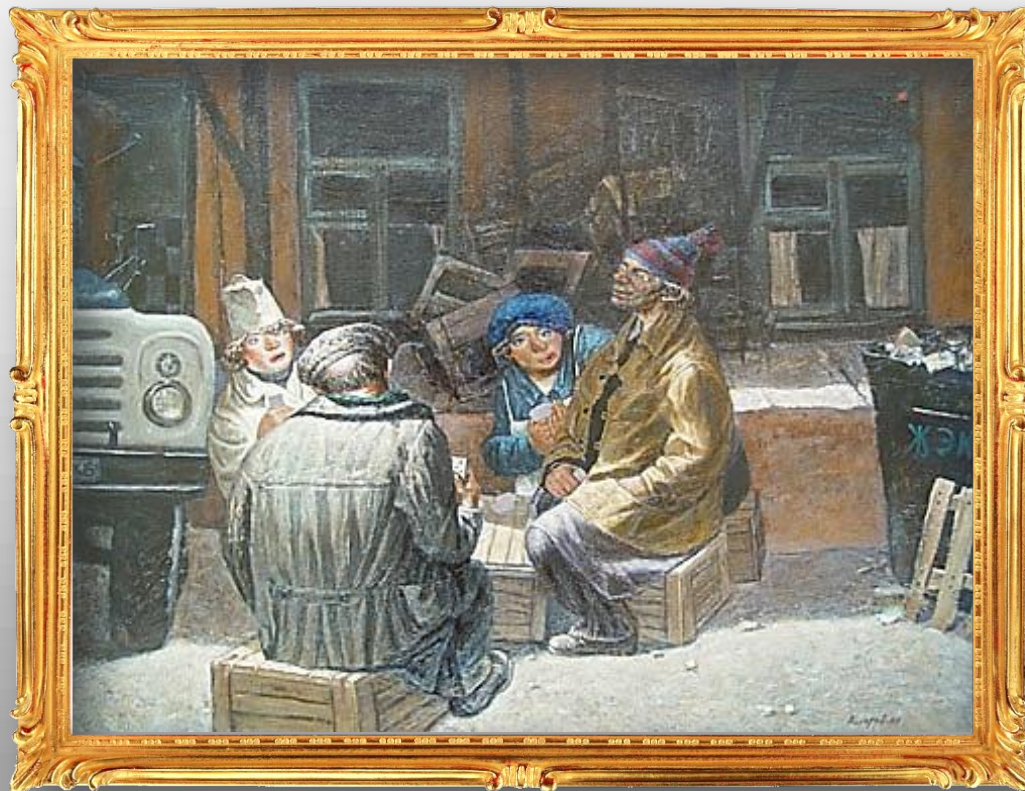
Крестикозыри. 1987 г.

И гра в карты каких-то грузчиков и продавщиц на заднем дворе магазина. На мусорном баке кривыми буквами выведено «ЖЭК».