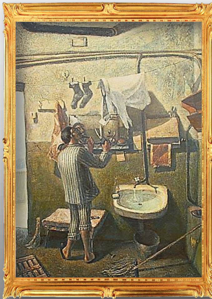
Утро соседа. 1984 г.