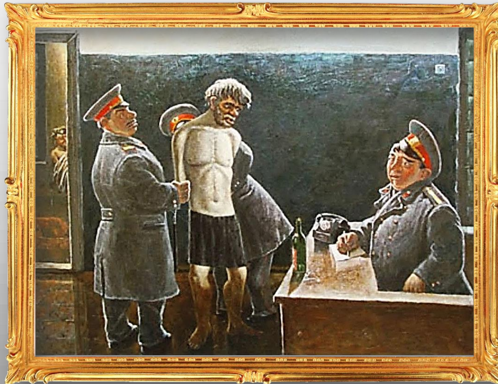
Арест пропагандиста. Медвытрезвитель. 1979 г.

Достаточно правдоподобно изображена жизнь советского вытрезвителя. Пленного алкоголика уже раздели и готовят, судя по всему, к ночёвке в общей камере.