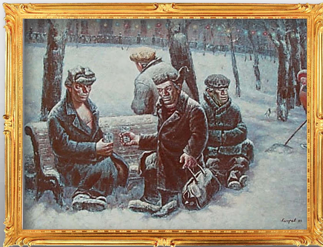
Бульварная сцена - 1. 1984 г.

Изображены дядьки, пьющие горькую прямо где-то на заснеженном бульваре. На заднем плане видна дворничиха, убирающая снег.