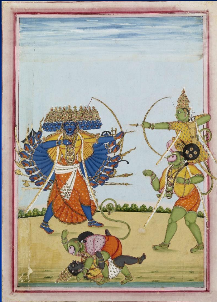
Бой Рамы с Раваной. Индийский рисунок

« Рамаяна » – поэма о путешествии царевича Рамы на юг Индии и борьбе с царем ракшасов Раваной