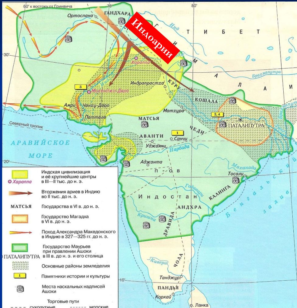
Древняя Индия. Карта