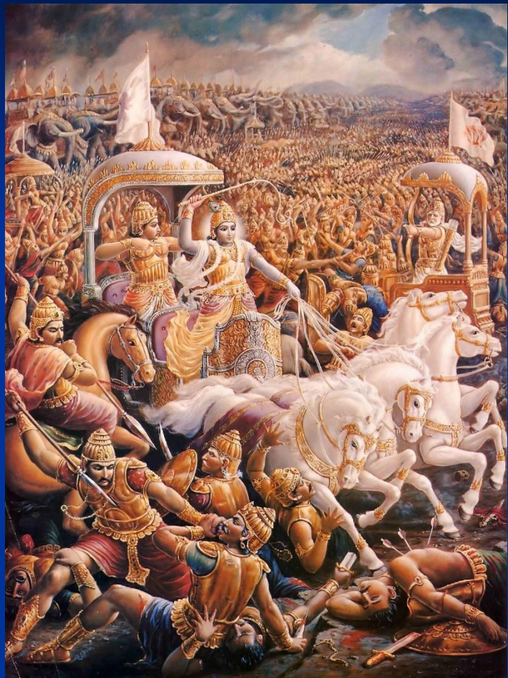
Битва на Курукшетре. Индийский рисунок

«Махабхарата» – поэма о войне Пандавов и Кауравов и великой битве на поле Курукшетра