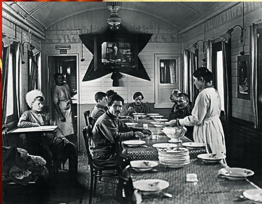
Агитпоезд «Октябрьская революция»