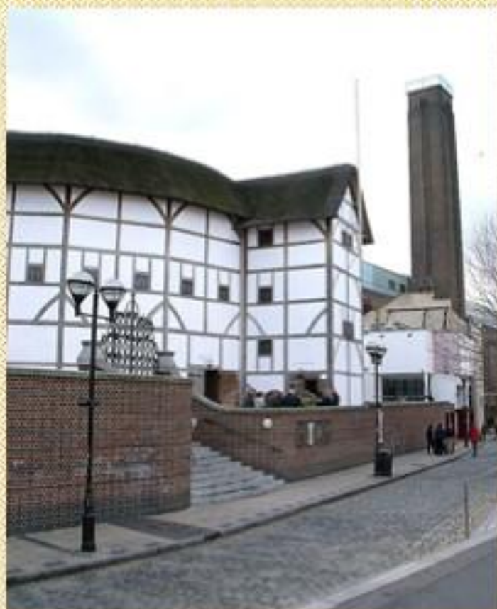
Воссозданный театр «Глобус», в котором работала труппа Шекспир

Шекспир был влюблён в театр. Окружающий мир он воспринимал как сцену, а людей — как актёров. Он верил в то, что театр должен стать школой, которая научит людей не сгибаться под ударами судьбы, презирать лицемерие, противостоять подлости.