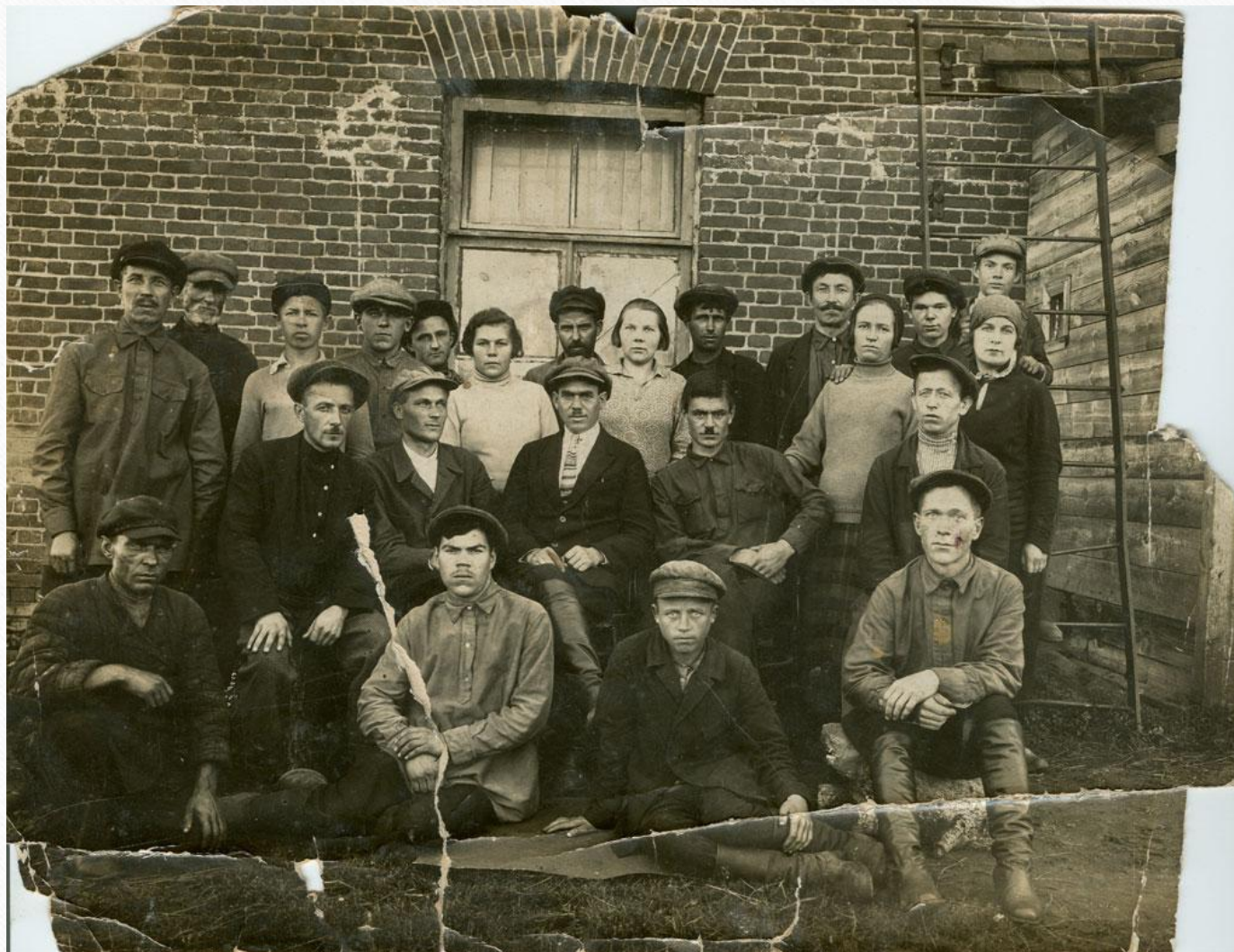
Работники венеvской типографии на улице Карла Маркса.