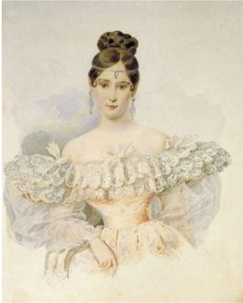
Наталья Николаевна Гончарова