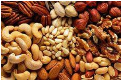
Орехи - пошти