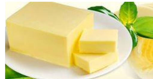
Масло - ой