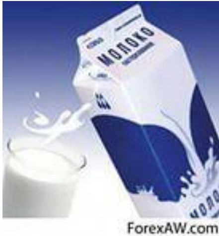
Молоко - ловсо