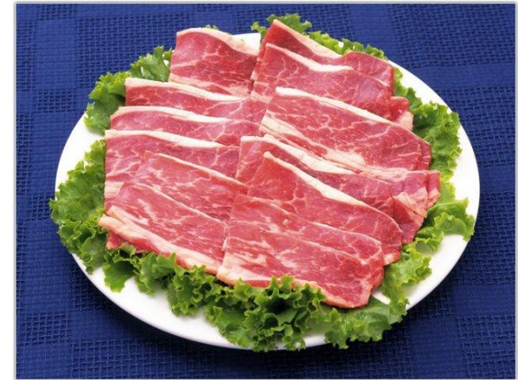
Мясо - сывель