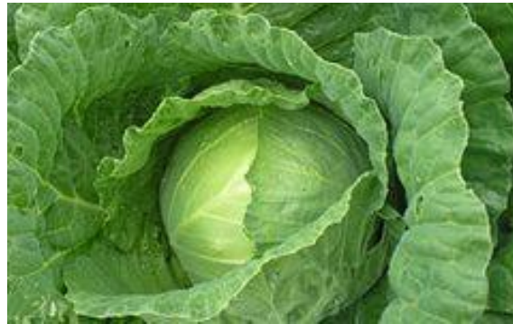
Капуста - капста