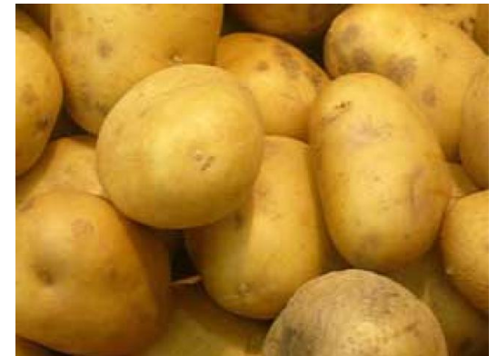
Картофель - модамарь