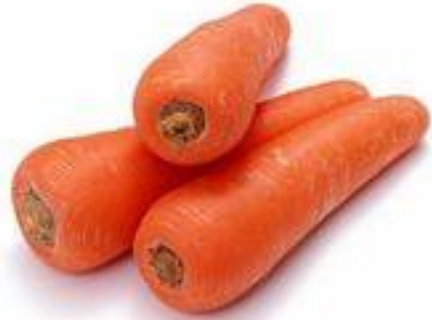
Морковь - пурька