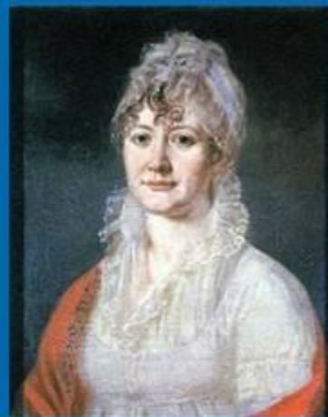
Бабушка. Елизавета Алексеевна Арсеньева (1773-1845)

Была одаренной и талантливой женщиной, любила играть на фортепиано. Умерла от на 22-м году жизни.