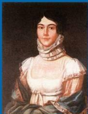
Мать. Марья Михайловна Лермонтова (1795-1817)

Капитан в отставке, красивый, статный и добрый мужчина. Он был часто вспыльчив и раздражителен.