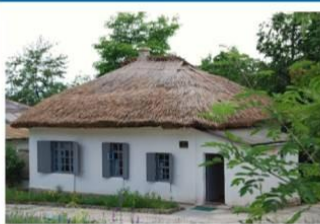
Домик в Пятигорске, где Лермонтов прожил последние два месяца своей жизни