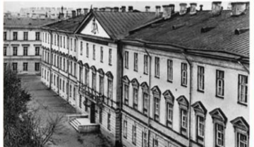
Николаевское кавалерийское училище, в стенах которого с 1832 по 1834 учился М.Ю. Лермонтов.