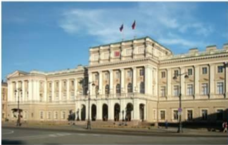
Мариинский дворец. Бывшее здание Школы Гвардейских Подпрапорщиков и Кавалерийских Юнкеров, в которой учился Лермонтов

Школа юнкеров сделала поэта образованным офицером, обладающим широким кругозором, знанием военной истории и основ военного искусства. В 1834 году Лермонтов начал служить в Гусарском полку в Царском селе. Служба в полку состояла не только в обычных военных занятиях, учениях, парадах, но и в обязательном посещении придворных балов.