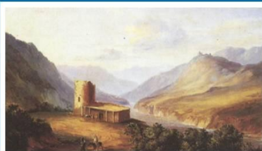
Военно-Грузинская дорога близ Мцхеты. 1837. Картина Лермонтова.

Благодаря ходатайствам бабушки возвращается в Петербург, восстанавливается на службе. Дальнейшее творчество Михаила Юрьевича Лермонтова связано с редакцией "Отечественных записок".