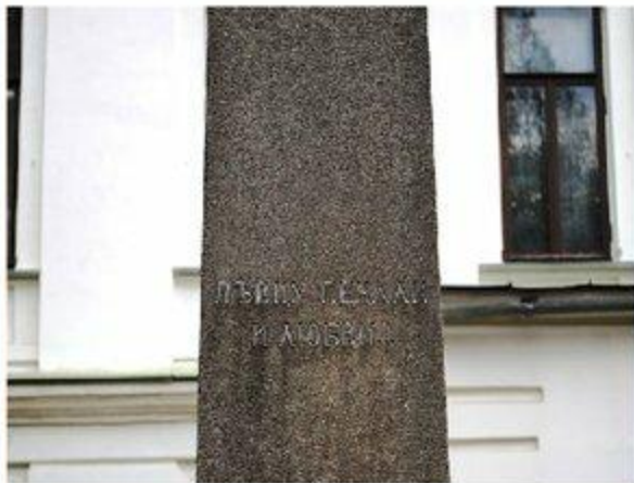
В память о пребывании в 1830—1831 гг. Лермонтова в Средникове установлен обелиск.