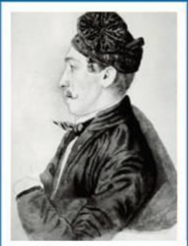
Убийца Лермонтова Николай Мартынов