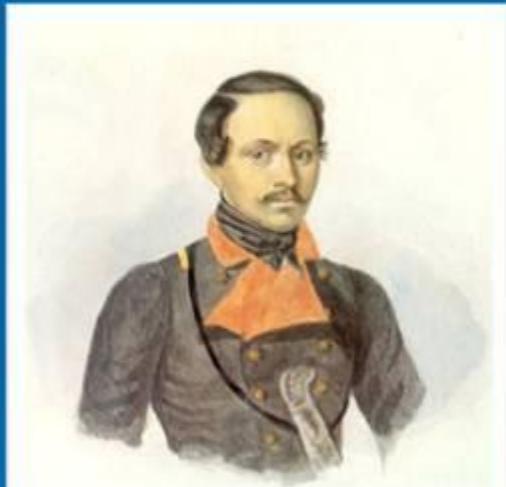
Последний прижизненный портрет Лермонтова. 1841 г.

В Пятигорске, возвращаясь со второй ссылки, Лермонтов встретил старого товарища Мартынова. Тот, оскорбившись на злую шутку поэта, вызывает Лермонтова на дуэль. 15 (27) июля 1841 года на этой дуэли Лермонтов был убит.