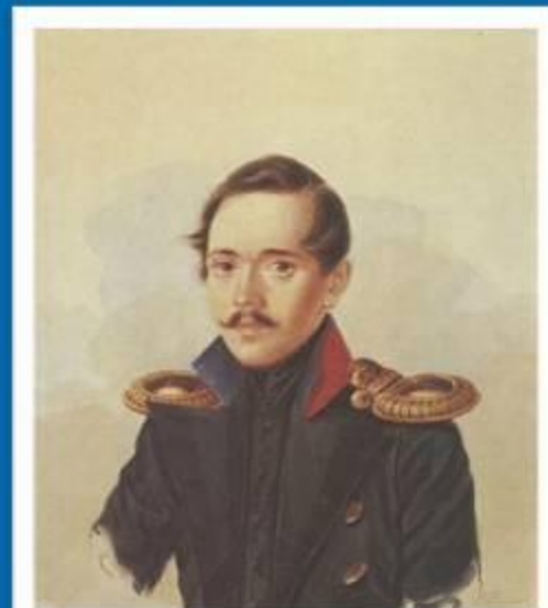
Лермонтов после возвращения из первой ссылки. 1838 год.

В 1837 вместе с выходом стихотворения «Смерть поэта» (1837), посвященного смерти Пушкина к поэту приходит популярность. За это произведение Лермонтов был арестован и отправлен в ссылку на Кавказ. В это время Лермонтов создает свое знаменитое произведение «Бородино» (1837) к годовщине сражения. Восхищенный природой Кавказа, он пишет стихи и занимается живописью.