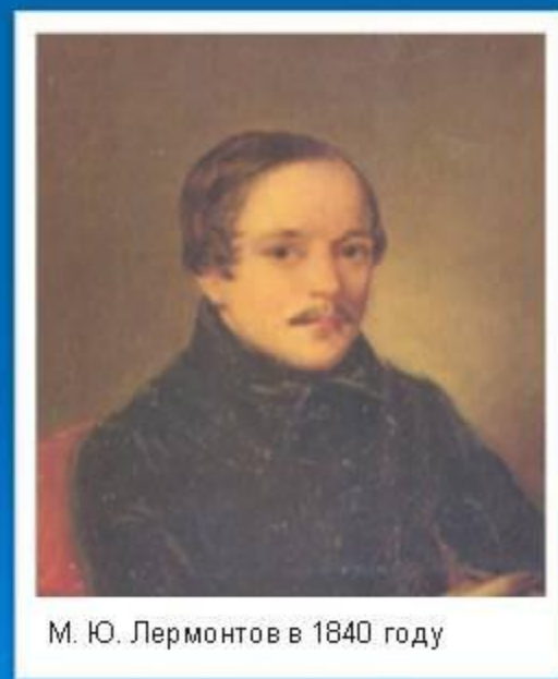
М. Ю. Лермонтов в 1840 году

В 1840 за дуэль с сыном французского посла Э. Барантом поэт снова отправлен в ссылку. Прибыв на Кавказ, Лермонтов окунулся в боевую жизнь, был задействован в военных действиях и на первых же порах отличился, согласно официальному донесению, «мужеством и хладнокровием».