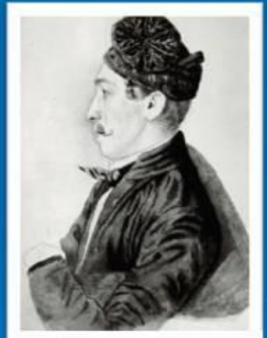
Убийца Лермонтова Николай Мартынов