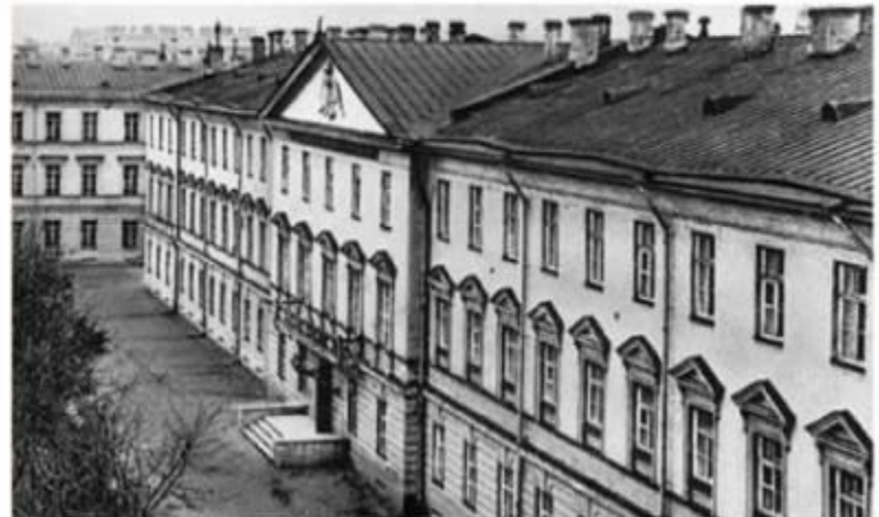
Николаевское кавалерийское училище, в стенах которого с 1832 по 1834 учился М.Ю. Лермонтов.