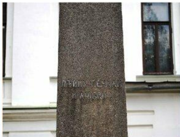
В память о пребывании в 1830—1831 гг. Лермонтова в Средникове установлен обелиск.