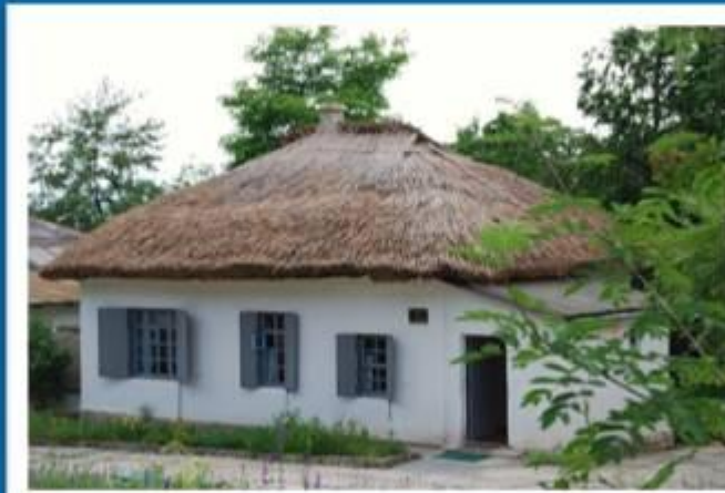
Домик в Пятигорске, где Лермонтов прожил последние два месяца своей жизни