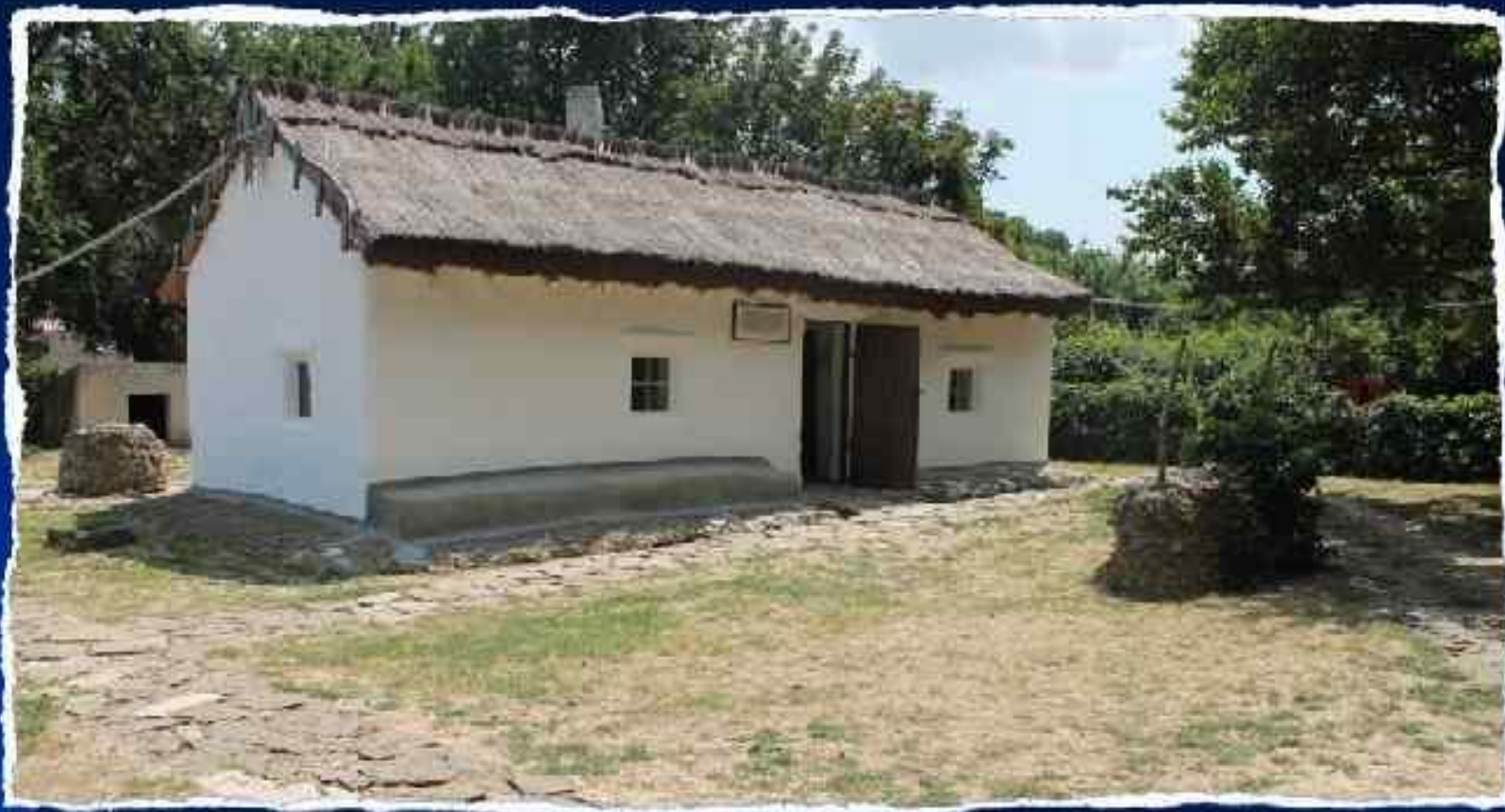
Музей Лермонтова в Тамани