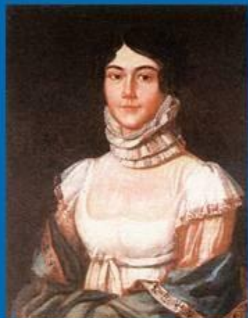
Мать. Марья Михайловна Лермонтова (1795-1817)

Капитан в отставке, красивый, статный и добрый мужчина. Он был часто вспыльчив и раздражителен.