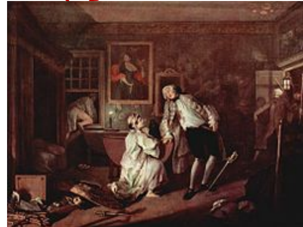
«Дуэль и смерть графа»