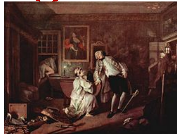
«Дуэль и смерть графа»