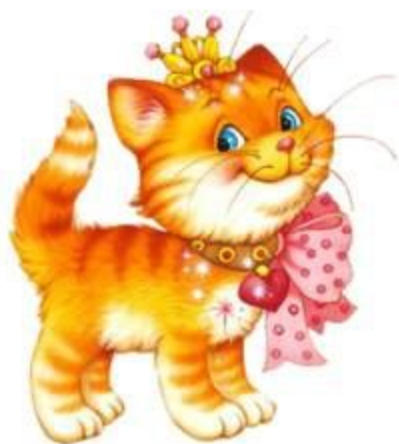
кот М урка