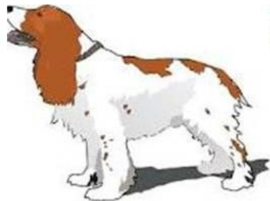
ака Р екс