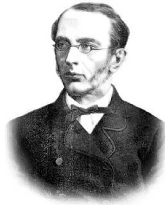
К. П. Победоносцев (1827 – 1907 г.)