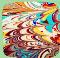
Рисование на воде "Эбру"