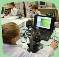
Детская биология "Биомир"