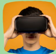
Мастер-класс в виртуальной реальности