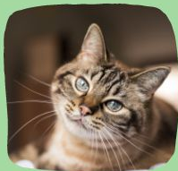
Уроки доброты Поход в Zoki Cat Cafe