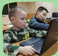
Робототехника Lego WeDo 2.0