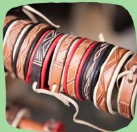
Плетение кожаных браслетов