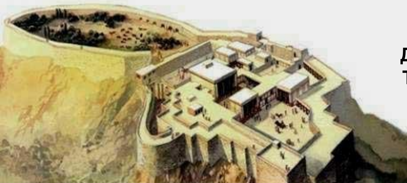
Дворец в Тиринфе