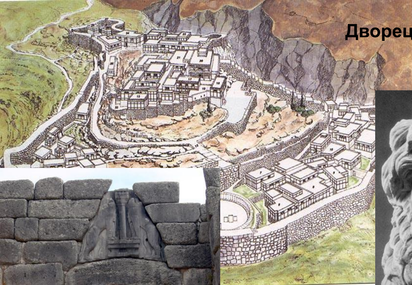
Дворец в Микенах