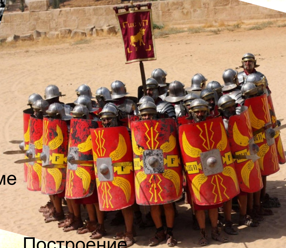
Построение «оборонительный круг!»