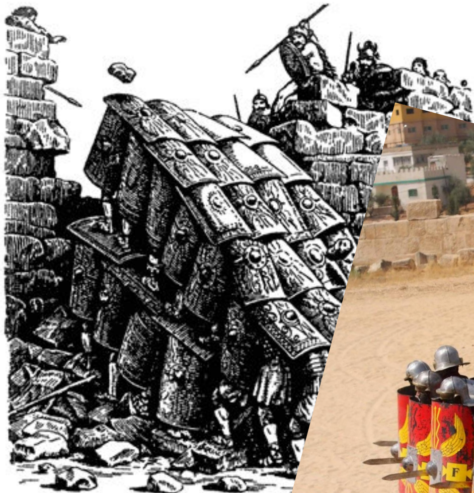
Черепаша при штурме крепостной стены.