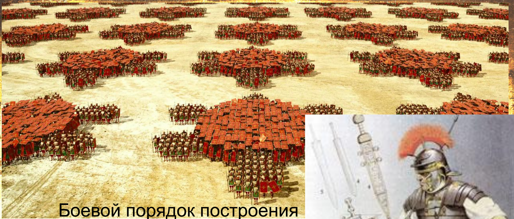
Боевой порядок построения римской пехоты.