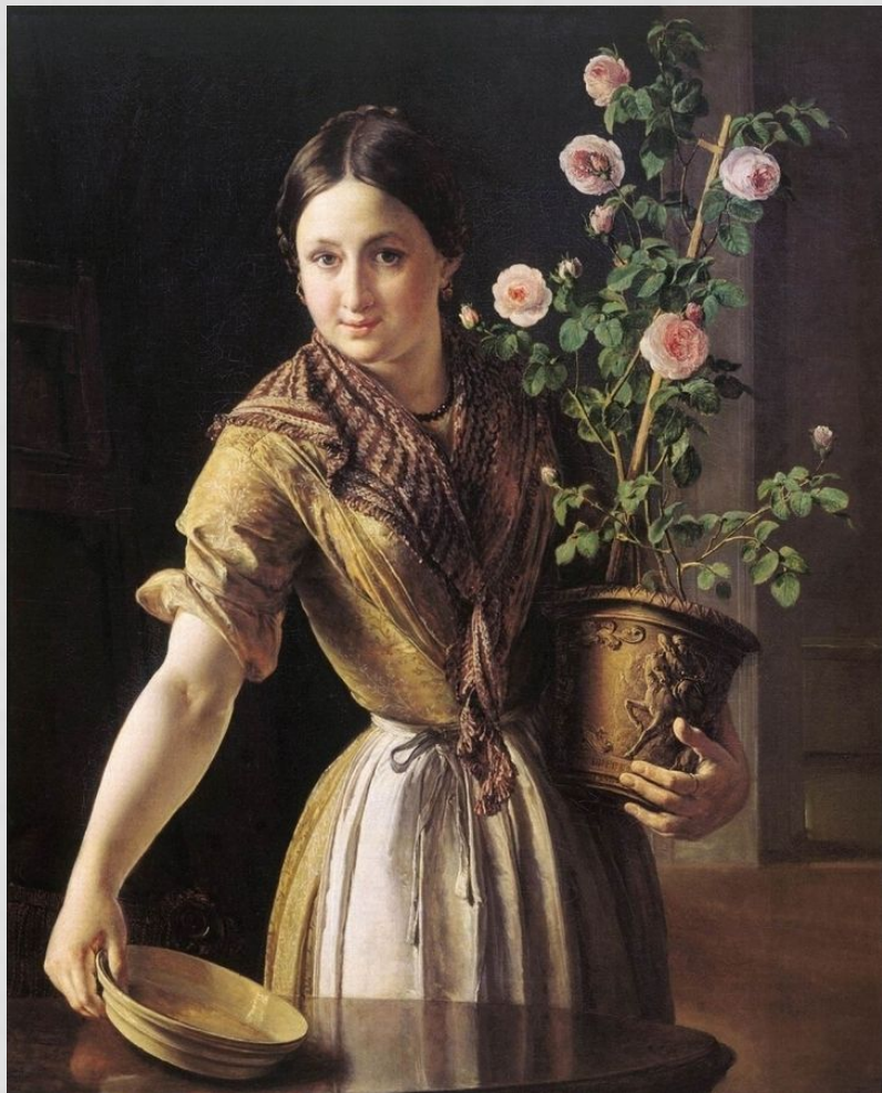
«Девушка с горшком роз»