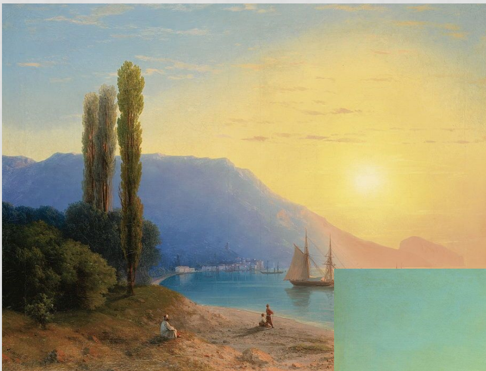
«Закат над Ялтой»