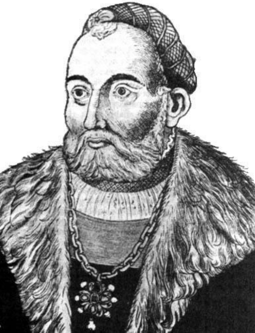
Szapolyai János Erhard Schön (1491-1542) fametszete. A feltételezések szerint a metszet a király hiteles arcképét ábrázolja