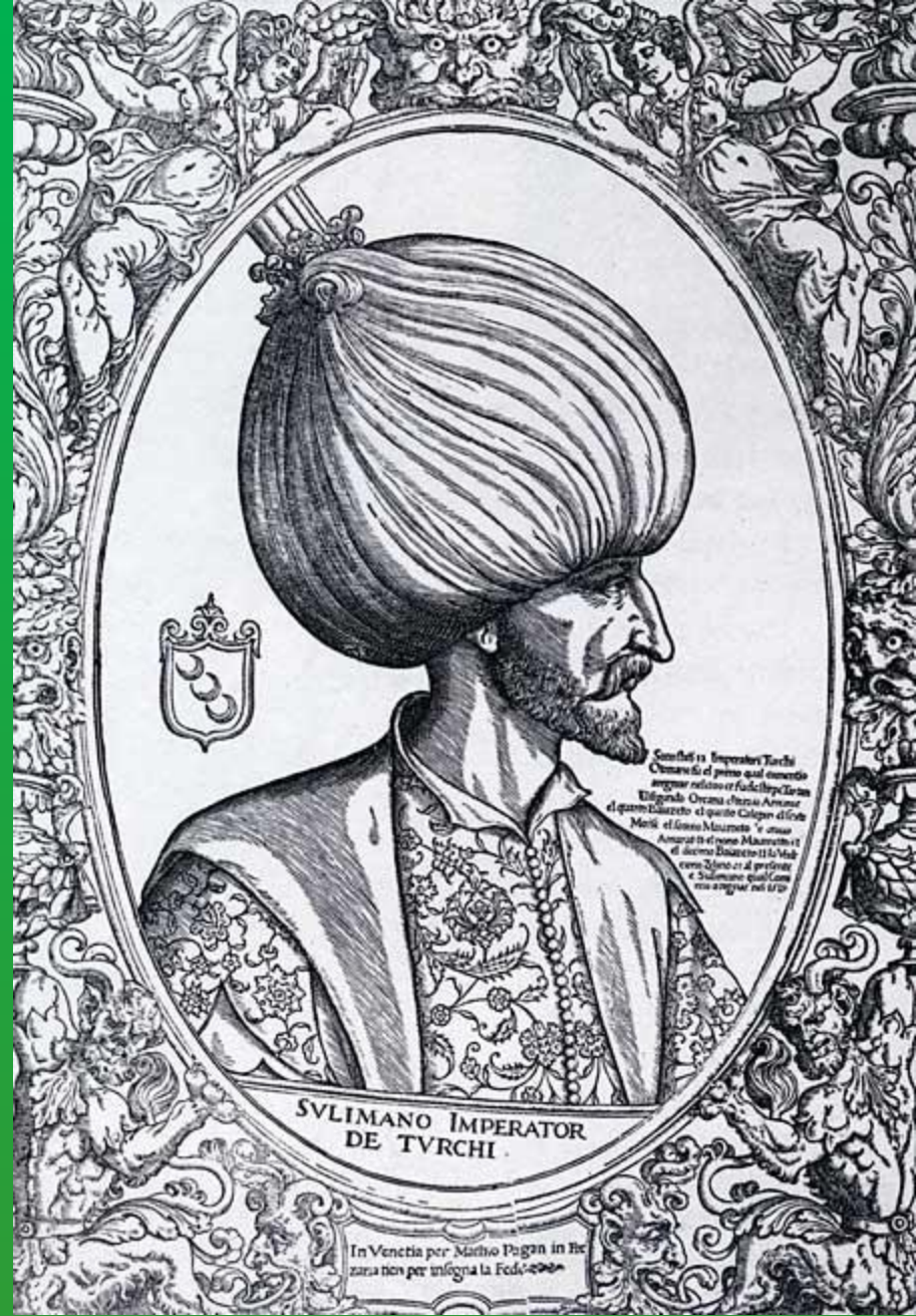
Nagy Szulejmán ábrázolások