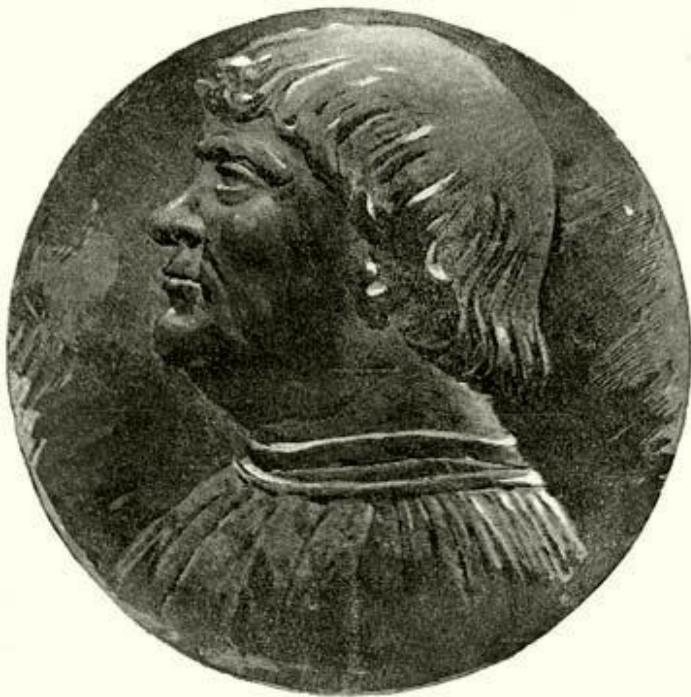
BAKÓCz TAMÁS ARCKÉPE, ÉRMÉRŐL NAGYÍTVÁ.