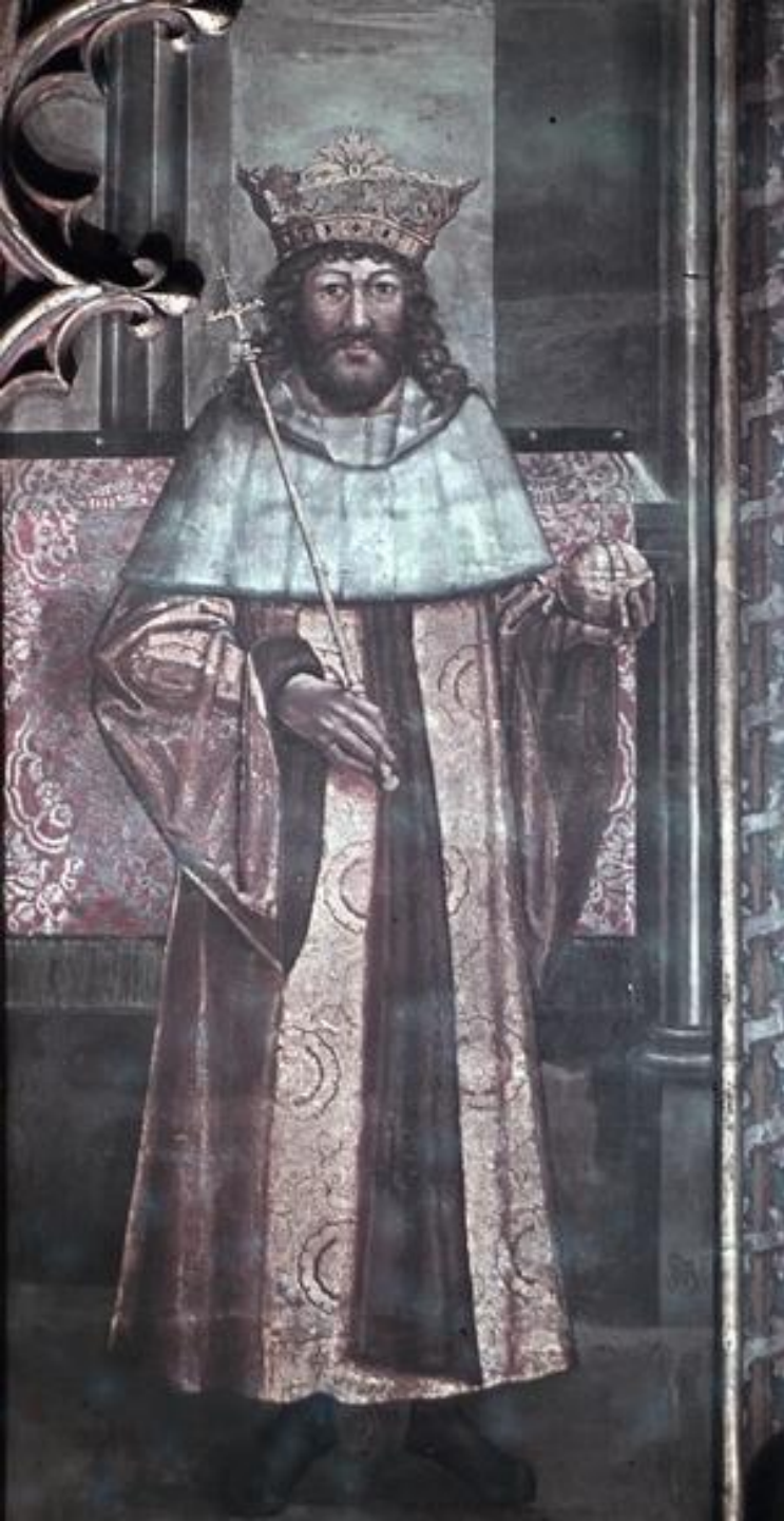
II. Ulászló 1509-ből való freskón a prágai Szent Vitus-székesegyház Szent Vencel-kápolnájában a Litoměřicei Oltárkép festőjétől