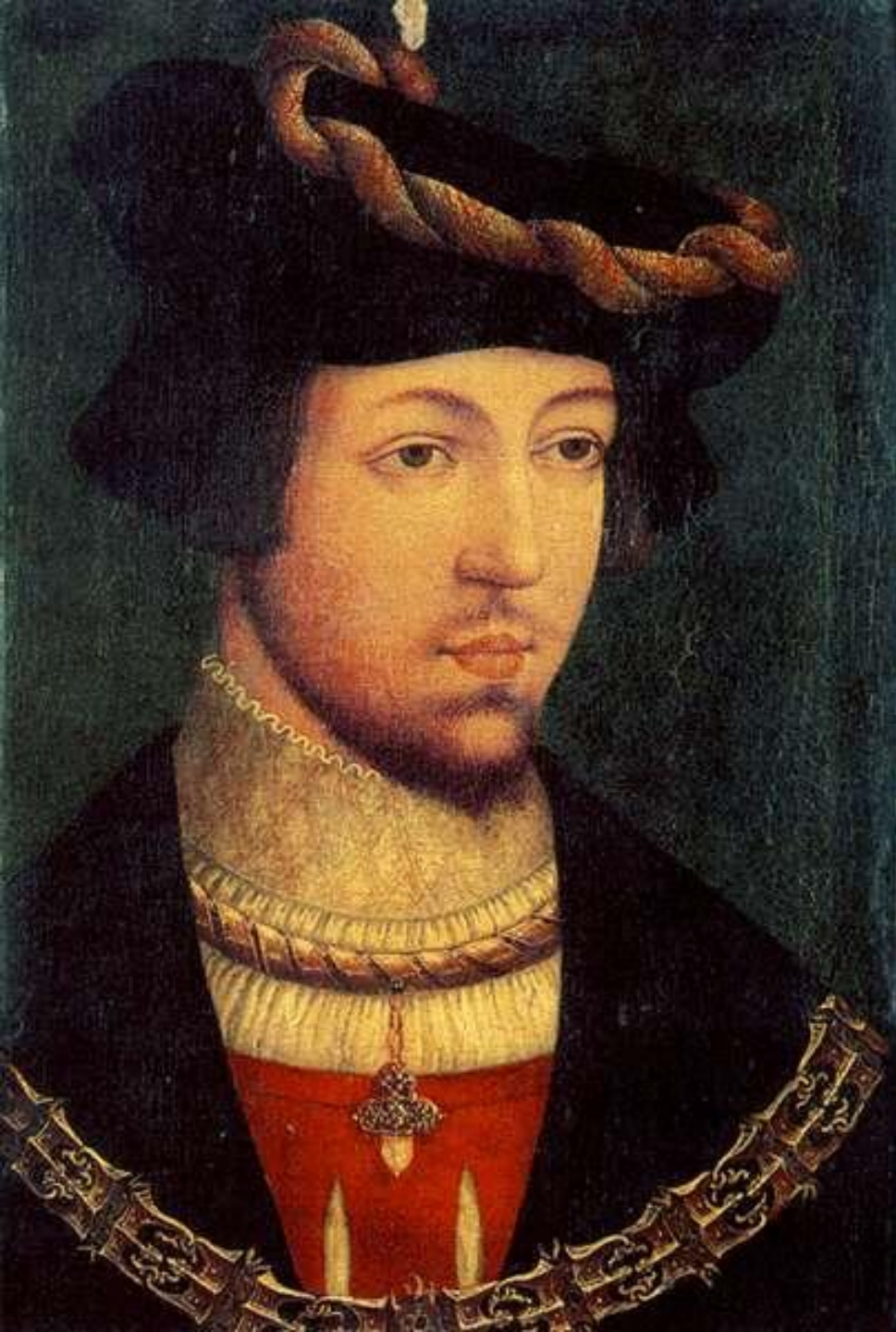
II. Lajos portréja Csukovits Enikő: Liliom és holló. Új Képes Történelem. Magyar Könyvklub- Helikon, Budapest, 1997, 96. oldal.