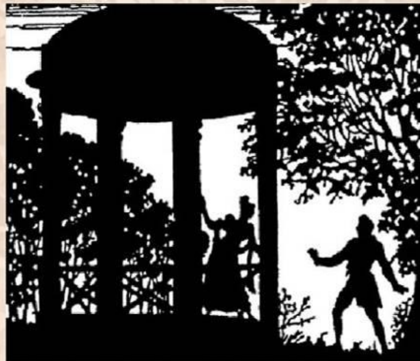
Б.М. Кустодиев. «Дубровский».

В XIX веке жанр авантюрно-приключенческого романа стал популярным . Появились многочисленные произведения, где честность противопоставлялась подлости, щедрость - жадности, любовь - ненависти. Писатели для придания занимательности часто использовали «переодевания» героев и нарушения хронологии повествования. Главный герой такого произведения был неизменно красив, благороден, честен и смел. Заканчивался авантурный роман победой главного героя. А.С. Пушкин сделал попытку написать подобное произведение, но глубина вскрывшихся в его романе проблем реальной жизни не позволила ему закончить произведение. Пушкин не смог вместить живых героев в жесткие схемы.